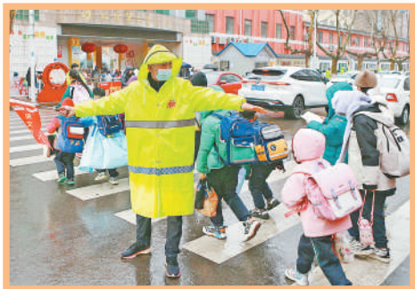
3月5日,山东省临沂市,志愿者协助维持学校门口交通秩序。