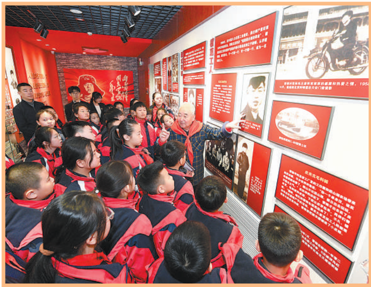
近日,“弘扬雷锋精神 建功伟大时代”主题活动在黑龙江省哈尔滨市举办,吸引了众多参观者。