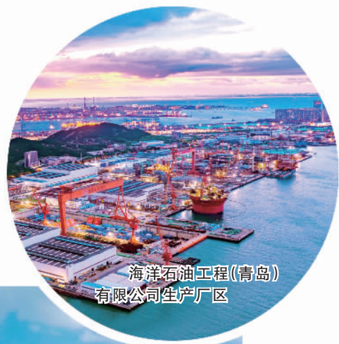
海洋石油工程(青岛)有限公司生产厂区