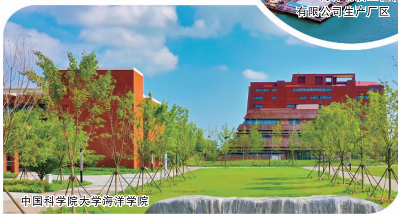
中国科学院大学海洋学院