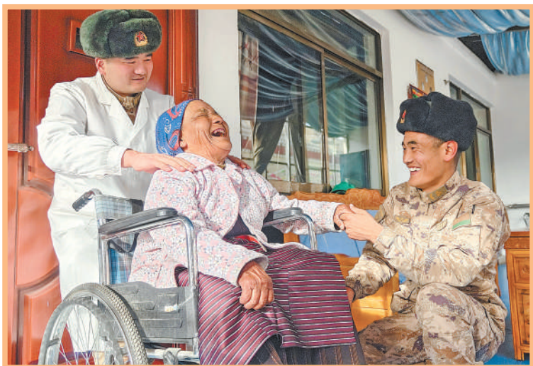
3月5日,西藏阿里军分区某边防团官兵走访帮助老人。