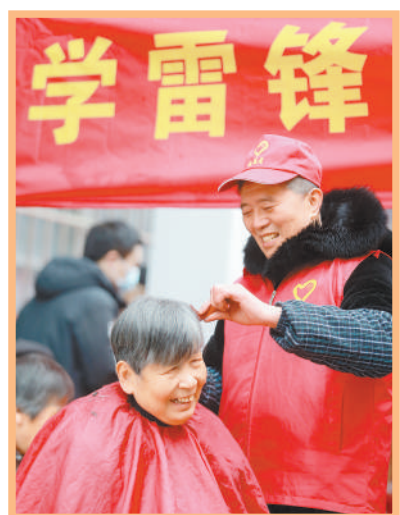
3月5日,江苏省扬州市,志愿者为居民理发。