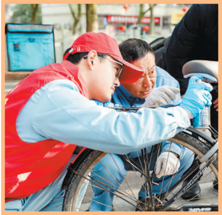
3月2日,浙江省宁波市,志愿者(左)为市民修理自行车。