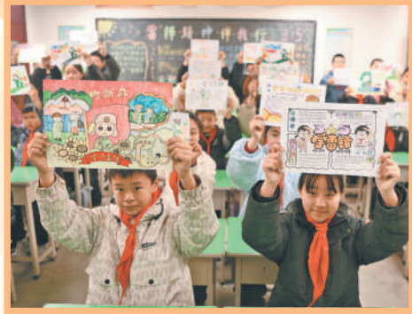
3月5日,河北省石家庄市,栾城区小学生展示“学习雷锋精神”手抄报。