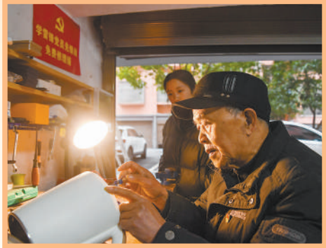
3月5日,江西省宜春市,袁州区东方社区一名老党员(右)义务为群众修理电器。

今年3月5日是第六十一个学雷锋纪念日。代表委员表示,要努力践行社会主义核心价值观,把个人追求融入为党和人民事业奋斗中,以实际行动书写新时代的雷锋故事,为中国式现代化建设贡献更多力量。