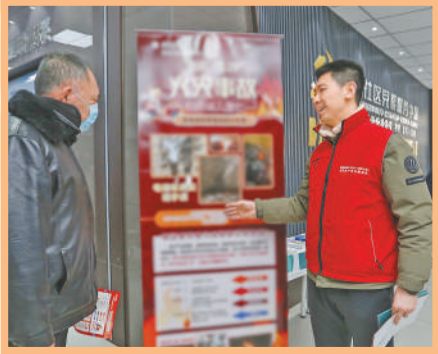
3月4日,辽宁省沈阳市,志愿者(右)为居民普及火灾预防知识。