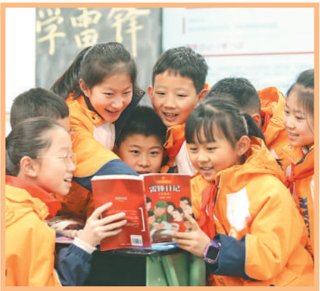
3月4日,四川省绵阳市,涪城区小学生阅读《雷锋日记》。