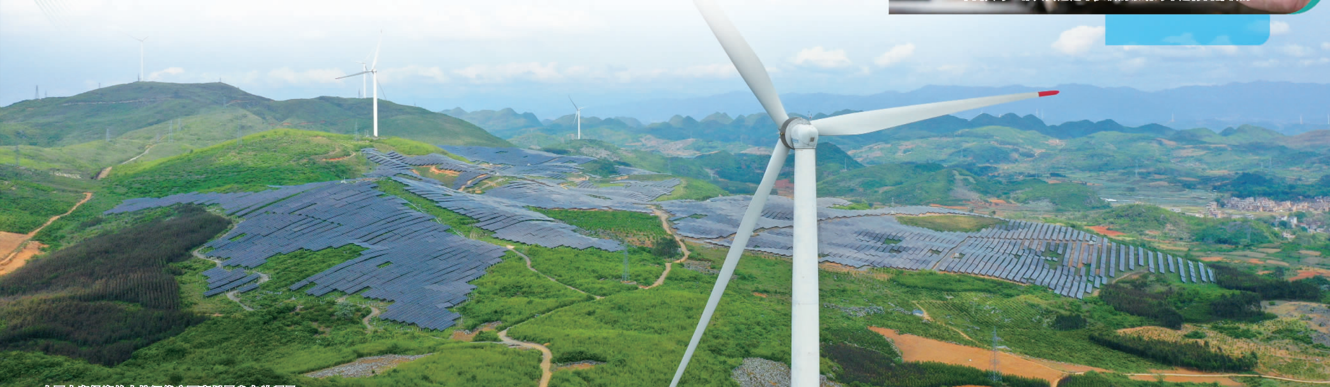
中国人寿投资的中核汇能广西富川风光电站项目