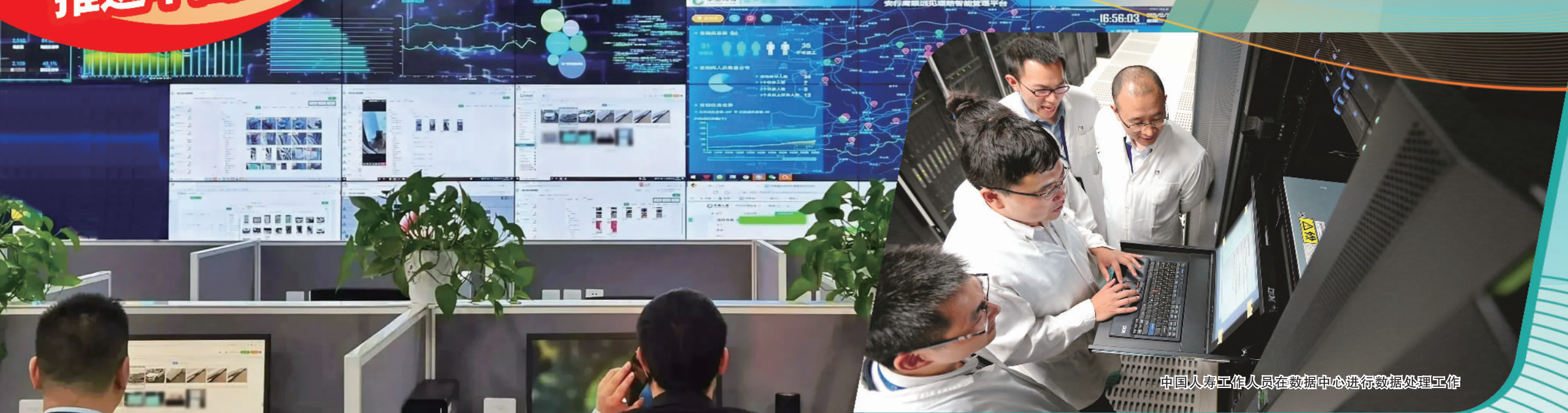
中国人寿工作人员使用智能理赔系统为客户提供理赔服务