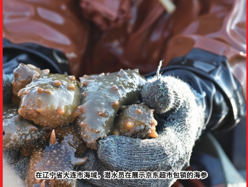
在辽宁省大连市海域，潜水员在展示京东超市包销的海参