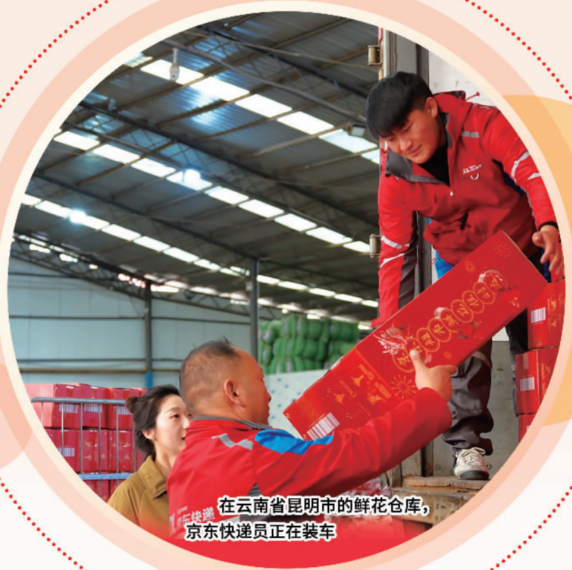
在云南省昆明市的鲜花仓库， 京东快递员正在装车