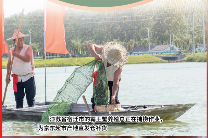
江苏省宿迁市的霸王蟹养殖户正在捕捞作业， 为京东超市产地直发仓补货