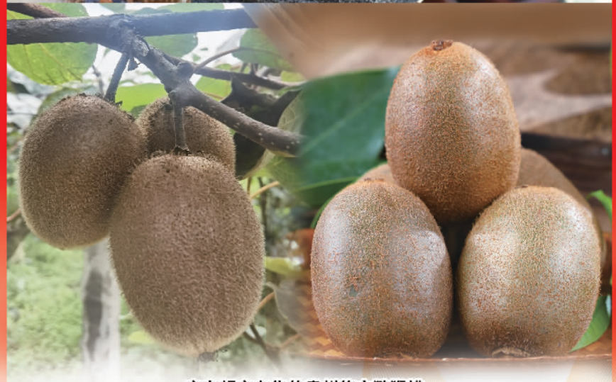
京东超市在售的贵州修文猕猴桃