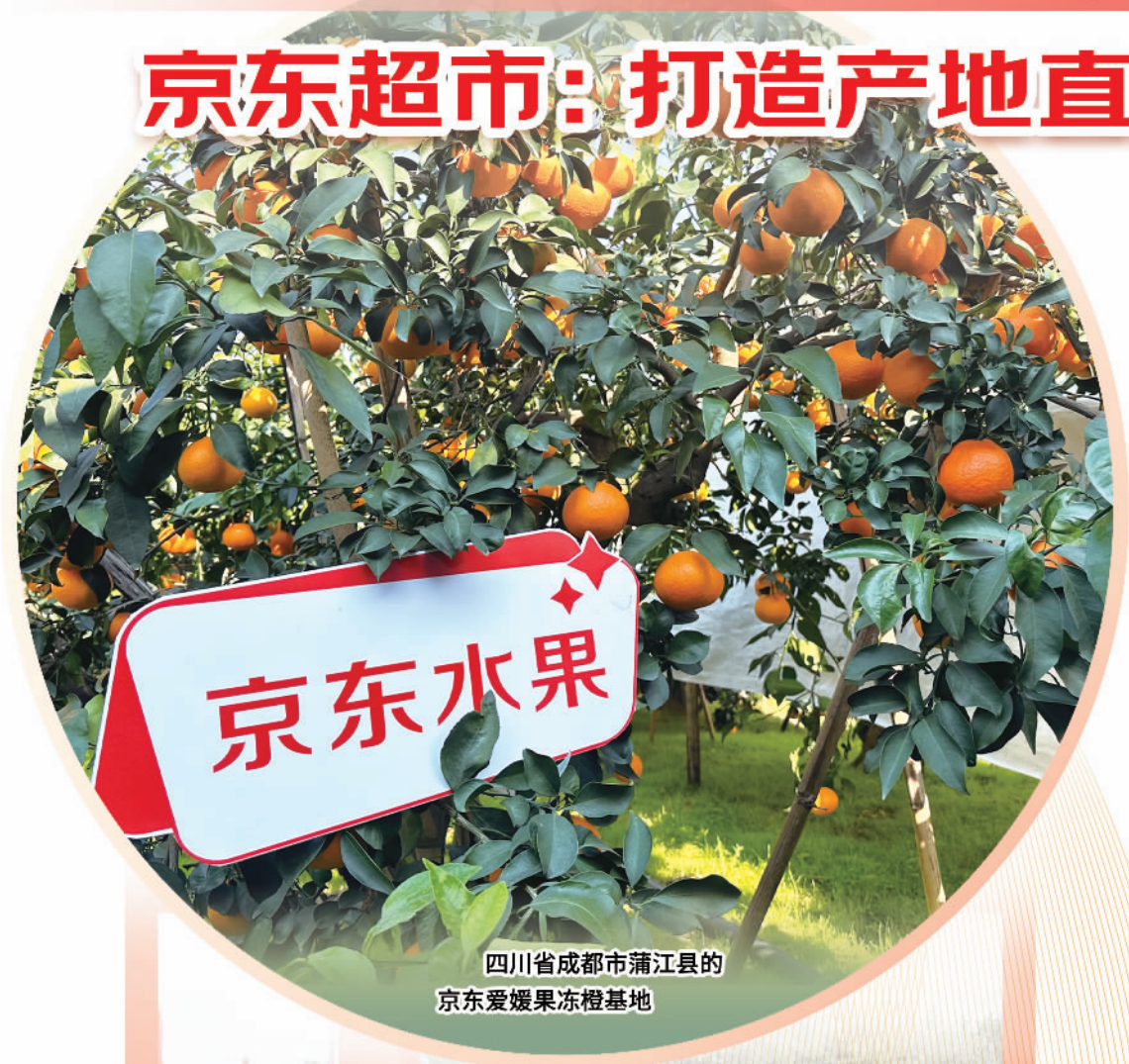
四川省成都市蒲江县的 京东爱媛果冻橙基地