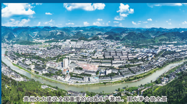
贵州大力建设全国重要的白酒生产基地。图为茅台镇全景