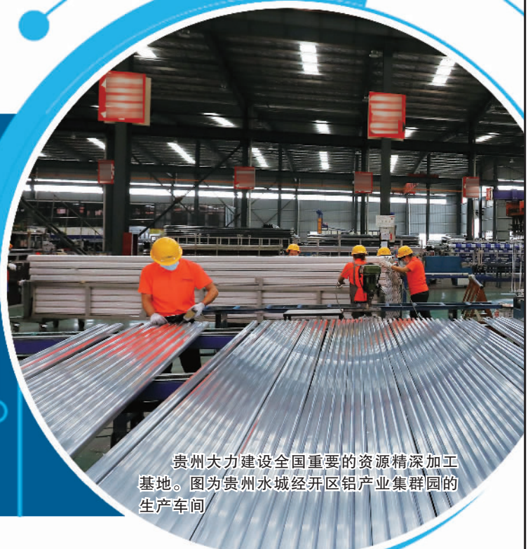
贵州大力建设全国重要的资源精深加工基地。图为贵州水城经开区铝产业集群园的生产车间