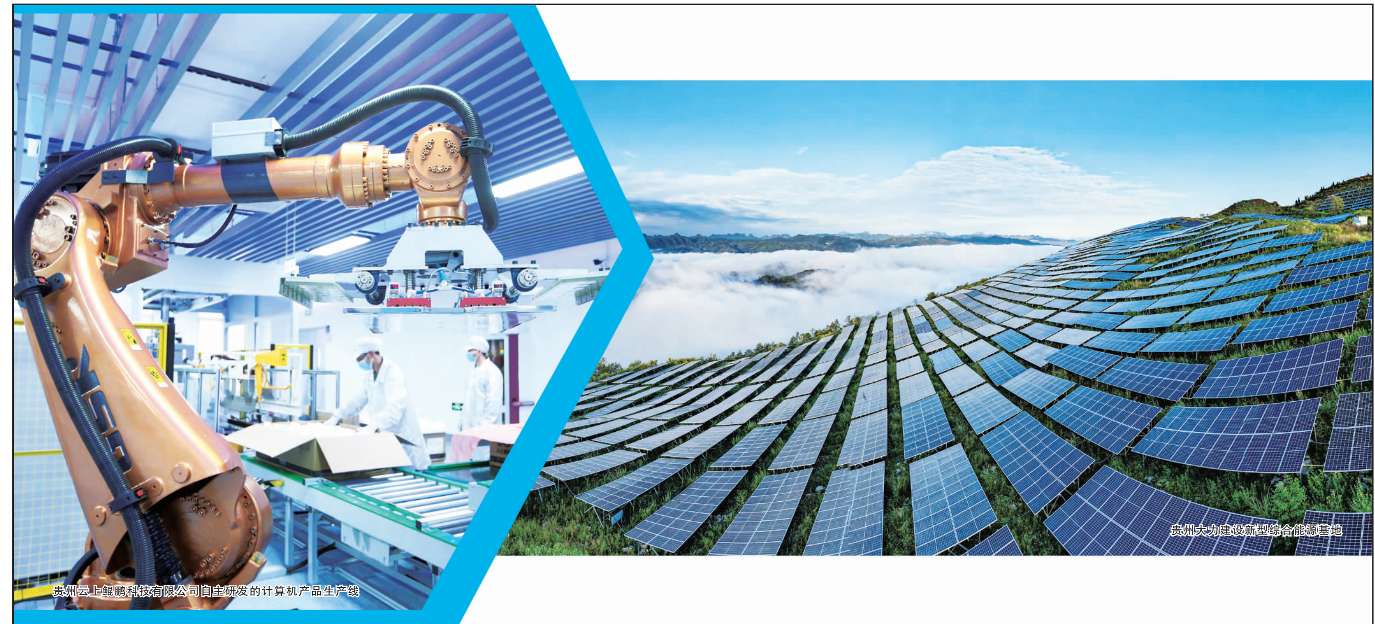
贵州云上鲲鹏科技有限公司自主研发的计算机产品生产线上