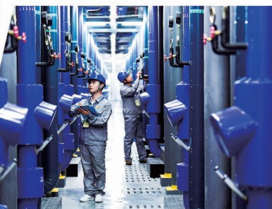
贵州加快打造全国算力高地。图为中国联通(贵安)云数据中心技术人员在机房内巡检