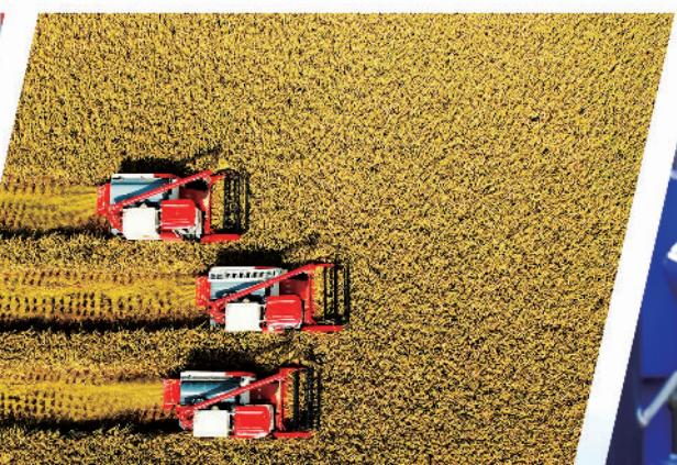
贵州持续提升农业机械化水平,加快推进农业现代化。图为贵州省黔南布依族苗族自治州龙里县农民驾驶农机收稻谷