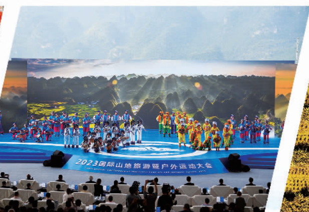
贵州乘势而上推动文旅高质量发展。图为2023国际山地旅游暨户外运动大会