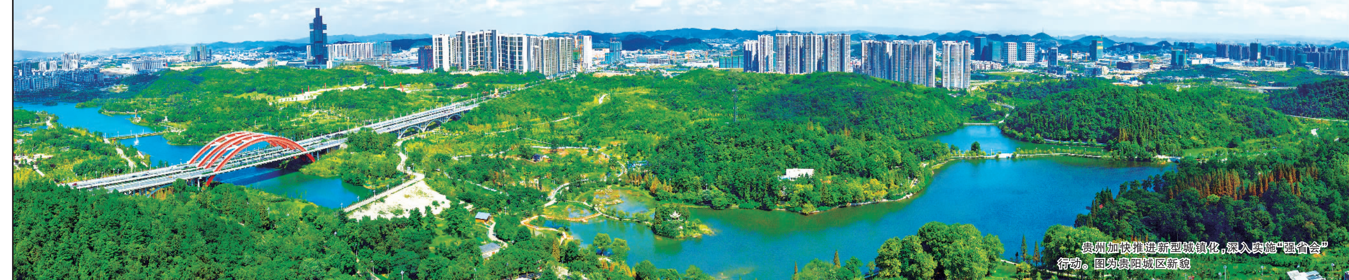
贵州加快推进新型城镇化,深入实施“强省会”行动。图为贵阳城区新貌