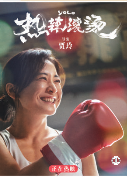
图①：电影《热辣滚烫》海报。 图②：电影《三大队》海报。 图③：电影《飞驰人生2》海报。 图④：电影《长安三万里》海报。