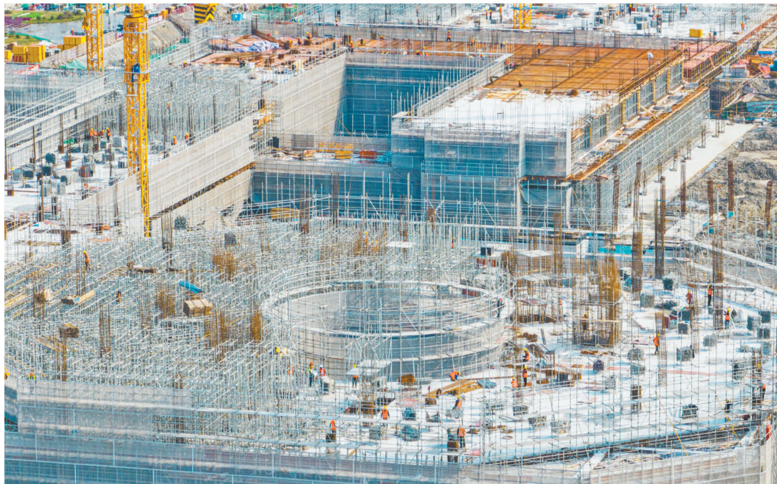
新春伊始,各地重大项目建设加快推进,企业加足马力赶制订单,春耕备耕陆续展开……热火朝天的生产景象随处可见。人们脚干劲,呈现出奋斗拼搏的精神面貌。图为2月18日,浙江省宁波市一处建筑工地的施工现场一派繁忙。

一年之计在于春。昂扬奋发的时代画卷里,“每一个平凡的人都作出了不平凡的贡献”。向着春天进发,朝着梦想奔跑,新的答卷正在书写。让我们以团结凝聚力量,以奋斗铸就伟业,众志成城同心干、撸起袖子加油干、久久为功扎实干,共同创造更美好的明天。