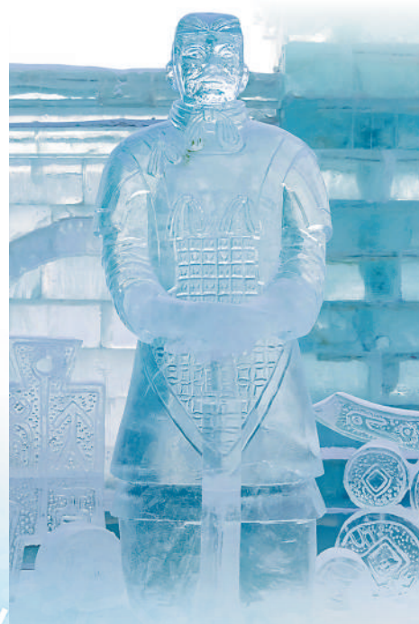
▲冰雕作品《兵马俑》。