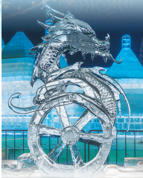
▼第三十五届中国·哈尔滨国际冰雕比赛参赛作品《龙腾盛世》，作者朱军华。