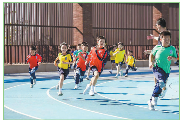
▲深圳前海哈罗港人子弟学校,学生们在操场上运动。该学校便利了香港学生就学,有力支持前海打造优质教育环境。