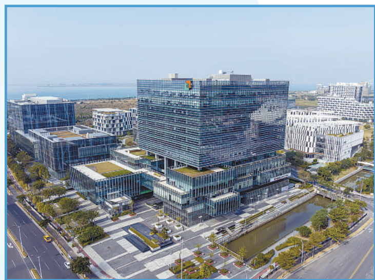
►横琴粤澳合作中医药科技产业园外景。该产业园是《粤澳合作框架协议》首个落地项目,是澳门发展中医药产业的重要载体和平台。