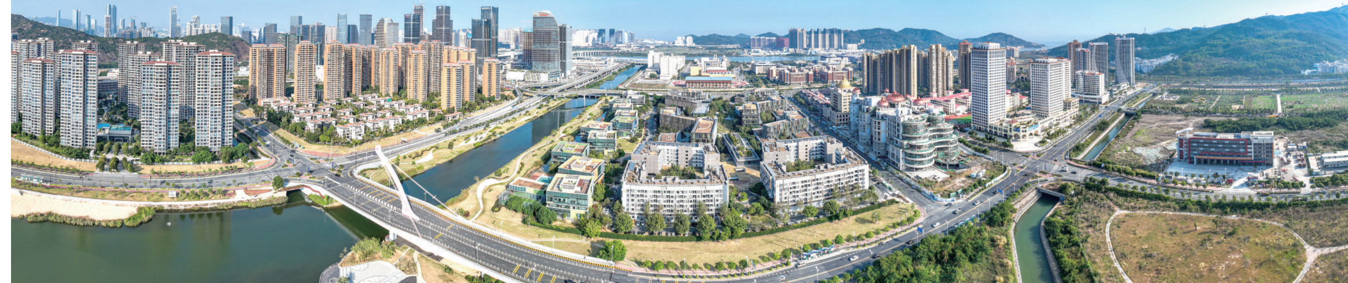
▼横琴·澳门青年创业谷俯瞰。青年创业谷是横琴粤澳深度合作区重点打造的产业落地、产业培育、产业发展平台,为港澳、内地青年创业者提供全方位服务。