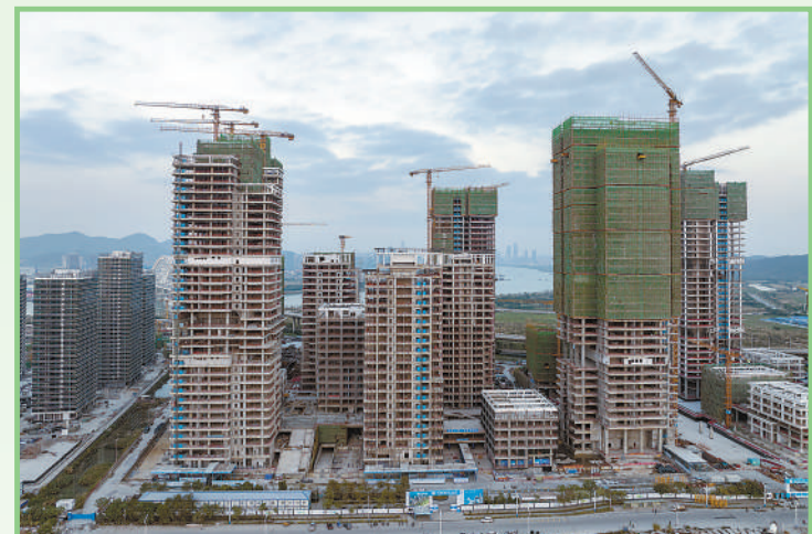
▲在横琴粤澳深度合作区西北部,横琴科学城(二期)项目正加紧建设。横琴科学城是横琴推动粤港澳深度合作的重要平台,将为科研产业人流、物流及信息流高速运转提供通道。