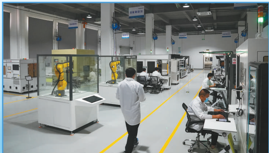
◀前海深港现代服务业合作区,一家科技公司的研发车间里,工作人员在调试设备。近年来,前海加快打造现代服务业高质量发展高地,推进现代服务业和先进制造业深度融合。