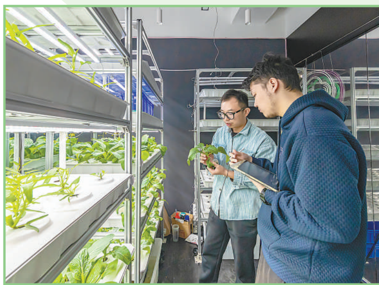
◀深圳前海深港青年梦工场北区,创业青年对水培植物进行数据收集。近年来,众多创业团队在这里持续探索科技创新,研发成果不断涌现。