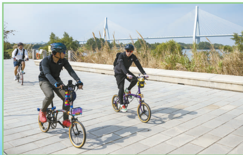
◀几名自行车运动爱好者在横琴芒洲湿地公园骑行锻炼。该公园位于横琴粤澳深度合作区西北角,吸引了珠海和澳门等地的众多游客前来休闲游玩。

本期统筹 沈寅 林琳 白之羽 本版责编 吕钟正 韩春瑶 林子夜 版式设计 张芳曼