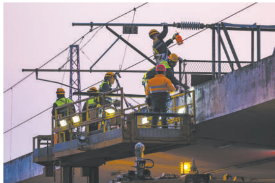
▼春节假期,国铁武汉局襄阳供电段职工在襄阳火车站清洗相关设备。