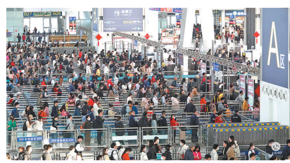
图①:春节假期,浙江绍兴,一列复兴号动车组列车正在行驶。 图②:正月初五,旅客在广州南站过安检准备乘车出行。