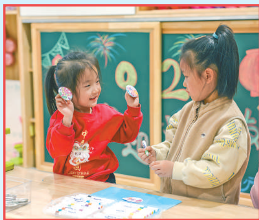
雄安北海幼儿园小朋友在教室里玩耍。

雄安新区管委会相关负责人表示，2024年新区将加快集聚“功能、项目、创新、支撑、人才、资源、生态、服务”8个要素，着力打造北京非首都功能疏解集中承载地等8个领域，高标准高质量推进雄安新区建设。