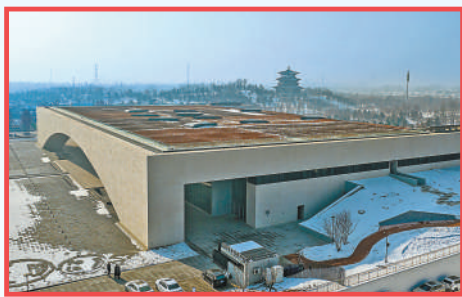
雄安城市计算中心外景。

围绕创新驱动，雄安新区重点发展新一代信息技术、生物医药、新材料三大产业方向，推进科创中心、中关村科技园等10余个重要创新和产业平台载体建设，着力打造自主创新和原始创新重要策源地。