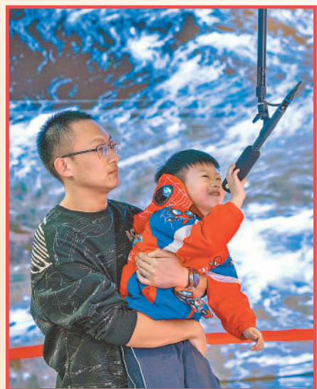
市民在北京城市图书馆元宇宙体验馆内游玩。