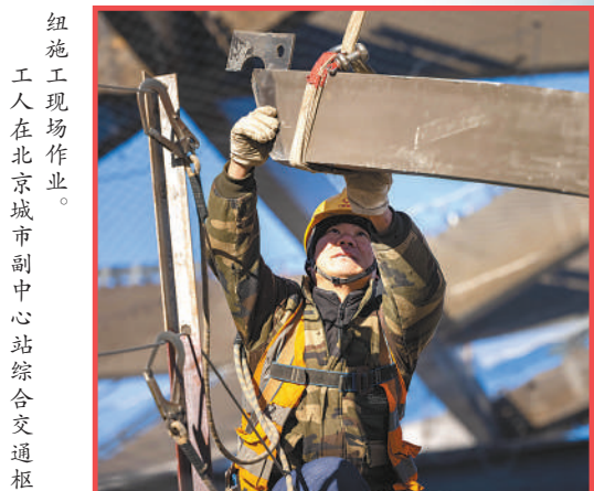
施工人员在北京市副中心站综合交通枢纽施工现场作业。

深化交通一体化。目前，北京东六环改造实现双隧道贯通，北京城市副中心站综合交通枢纽主体结构完工在望，轨道交通22号线通州段总工程量完成近半。培育发展新动能。2023年，北京通州与河北廊坊北三县项目推介洽谈会上，50个项目签约，意向投资超过400亿元。副中心政务中心一体化办事大厅在河北大厂县、天津武清区揭牌运行，实现政务服务跨区域通办，服务事项达3600余项。