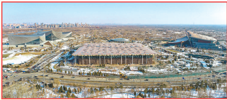
北京城市副中心三大文化设施。