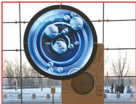
京雄城际铁路雄安站内的“千年轮”。

2023年12月28日，京雄高速全线通车运营，实现从北京西南五环到雄安新区1小时可达。硬件条件提升的同时，雄安新区抓住疏解北京非首都功能这个“牛鼻子”，出台政策、优化环境，通过软件条件升级让疏解单位和人员愿意来、留得住、发展好。2023年，雄安新区承接引进央企二级、三级子公司52家；截至2023年底，央企在新区设立子企业及各类分支机构达200多家。