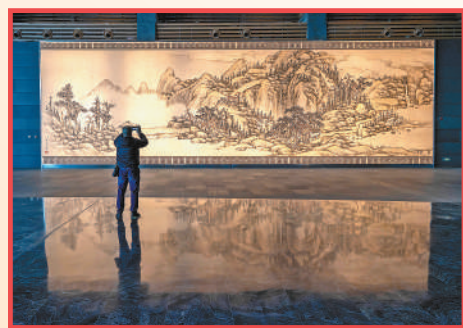
游客在北京大运河博物馆内拍照留念。