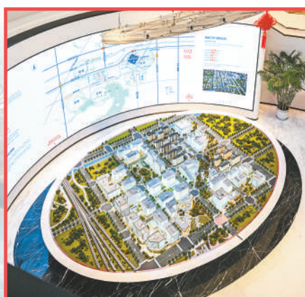
河北自贸试验区雄安片区交流展示中心。

据雄安新区管委会相关负责人介绍，下一步，将紧紧围绕服务京津冀协同发展和高质量建设雄安新区两大任务，以服务北京非首都功能疏解为初心使命，为推动新区在更高起点上实现更高层次开放发展作出更大贡献。