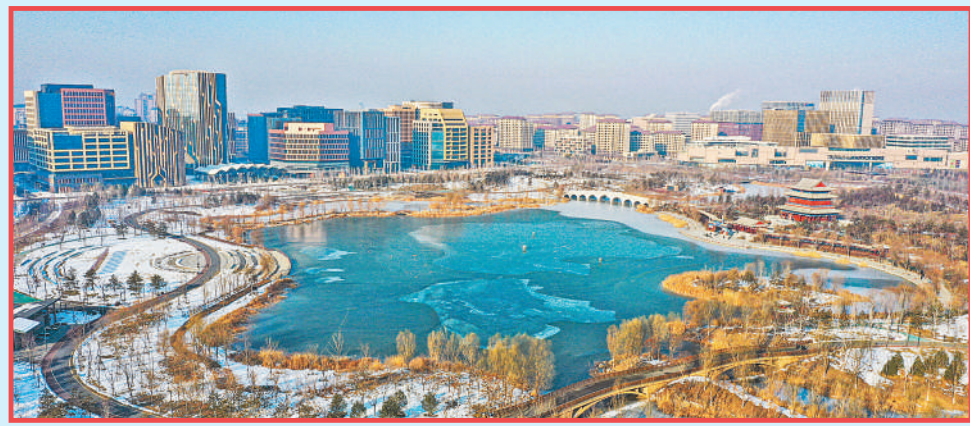
河北雄安新区金湖公园。