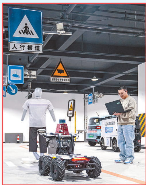
中国科学院雄安创新研究院内，科研人员在测试自动驾驶设备。