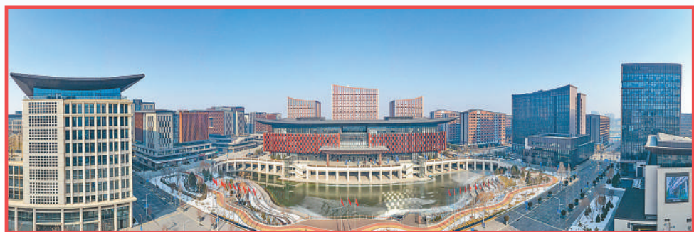
雄安商务服务中心外景。