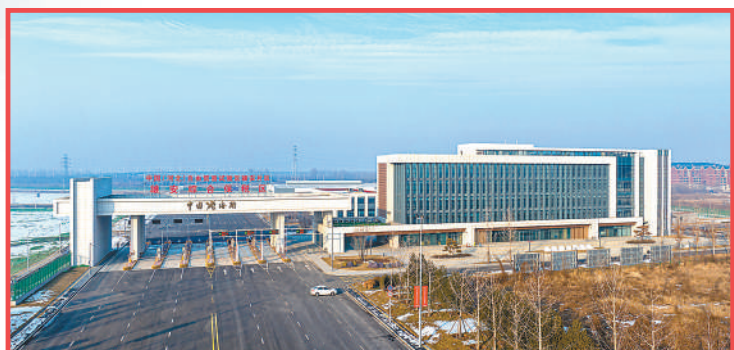
雄安综合保税区外景。