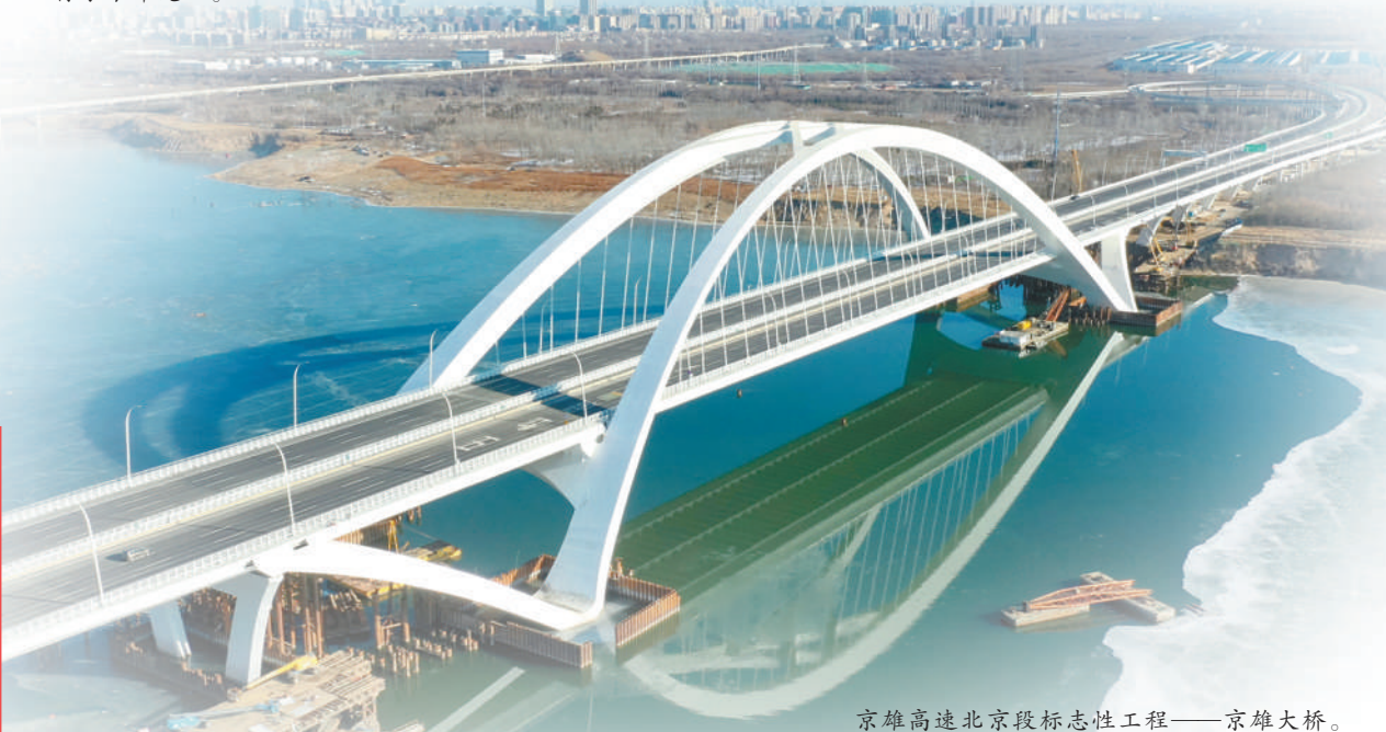
京雄高速北京段标志性工程——京雄大桥。

稿件采写：本报记者王昊男、张志锋 本版责编：程聚新、蒋雪婕、吕莉 版式设计：张芳曼、张丹峰