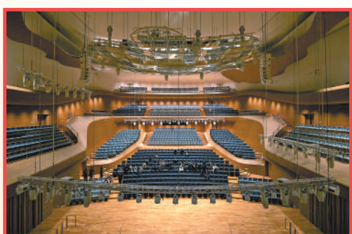
北京艺术中心内景。