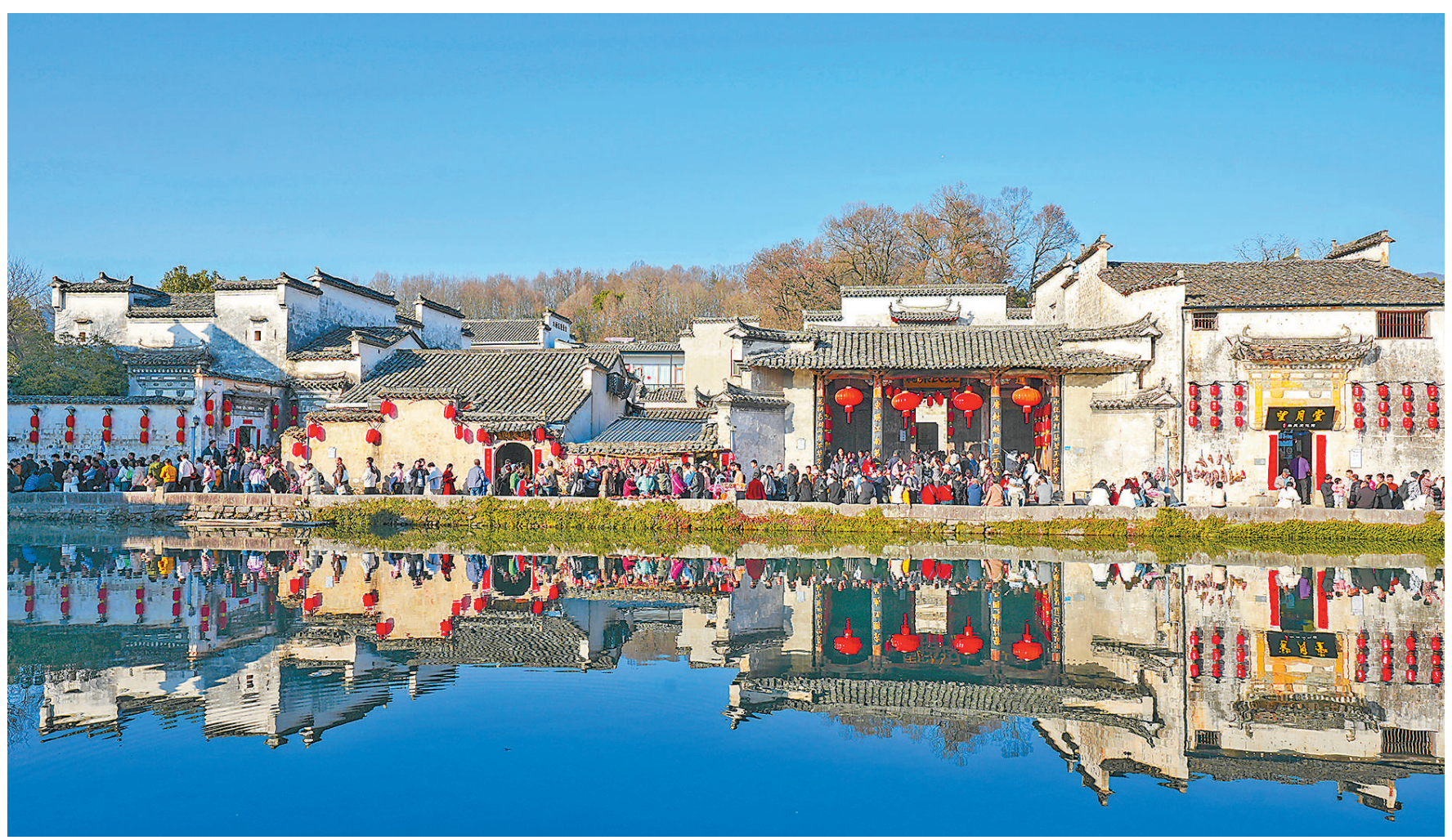
▲春节假期,安徽黄山市黟县乡村景区挂起红灯笼,喜庆热闹。