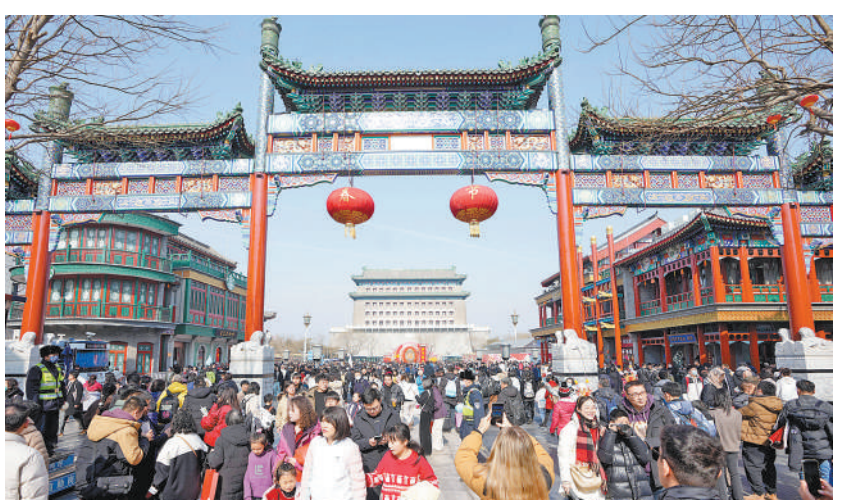
大年初四,市民和游客在北京前门大街游览。

旅市场升温。历史文化街区、传统村落等景点游人如织,生态度假、冰雪旅游等消费方式热度走高。人们利用假期走出家门,领略大好河山,品味文化魅力。春节假期,文化活动丰富多彩,文旅市场活力迸发,神州大地充满喜庆欢快的浓浓年味。