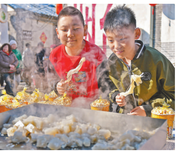
▲大年初四,小朋友在山东烟台芝罘区一处文化街区游玩,品尝特色小吃。