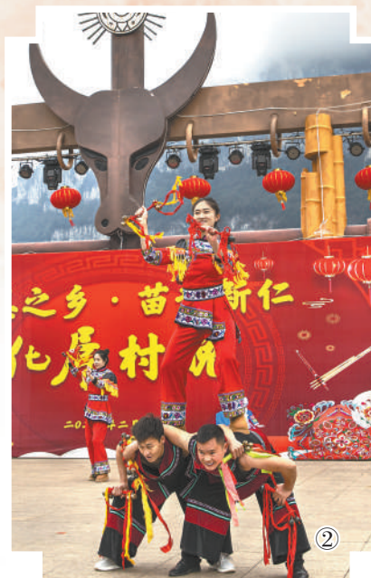
图②:表演团队在贵州毕节黔西市新仁苗族化屋村“村晚”现场演出。