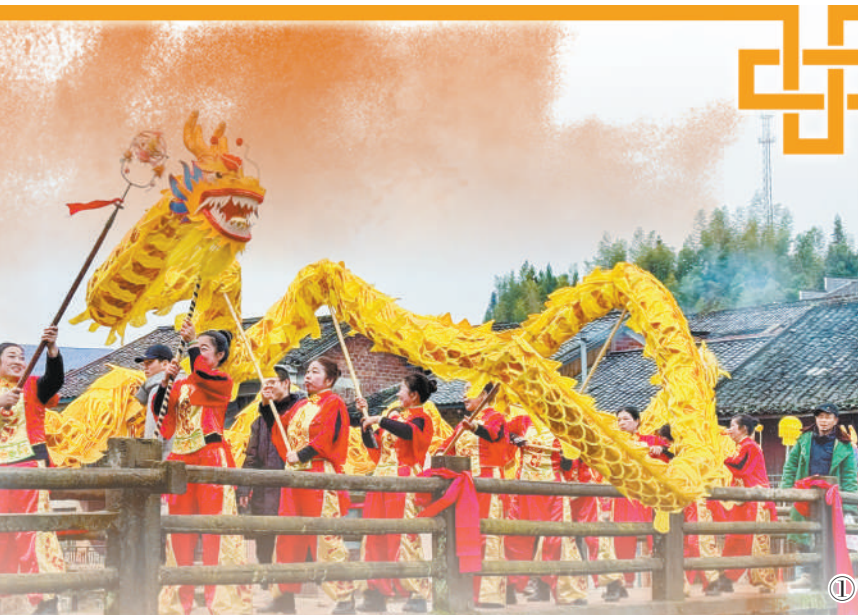
图①:湖南长沙浏阳市大围山镇白沙村“村晚”现场,舞龙表演。

演出间歇,穿插“广告”。工作人员端着盘子走上来,盘子里装的正是当地特色小吃金钩海米,供游客免费品尝。“欣赏自然风光之余,还能看‘村晚’、品