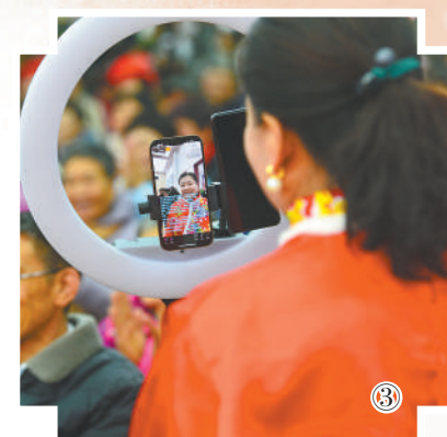
北也拿起手机直播“村晚”节目,顺便把豆腐乳、辣椒粉、蜂蜜等特色农产品推荐给网友:“我们村山好水好,土特产更有味道,欢迎大家来下单品尝……”

当天,白沙村“村晚”还通过浏阳市融媒体中心“浏TV”视频号直播,引来5万余人次在线观看,近万网友点赞。“‘村晚’越来越火,得益于插上了互联网的翅膀,这使它吸引众多观众目光并成为一个村的亮丽名片。”周固坚说。