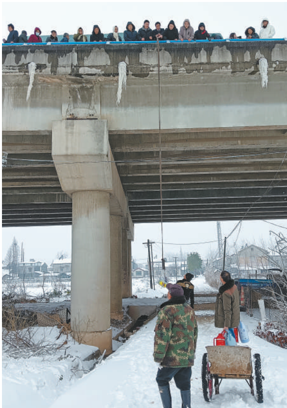
▲湖北省公安县埠河镇代市村村民，用绳索为因冰雪封路滞留高速的人们送去物资。