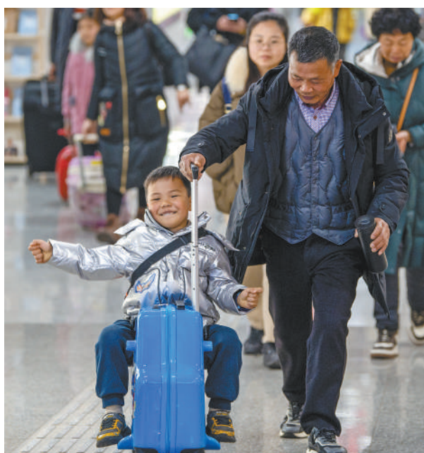
▲旅客走进浙江金华站。