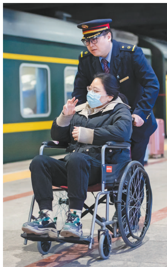
▲北京西站工作人员护送旅客进站乘车。

今年春运期间，全国跨区域人员流动量预计将达90亿人次。为了让人们平安返乡、温暖出行，各地各部门压实责任、协同配合，坚守安全底线红线；提升服务保障水平，针对性加大运力投放，强化不同运输方式衔接，根据务工人员等群体需求提供团体票预订、包车专列等服务，优化旅客出行体验。 无数人坚守岗位、连续奋战，努力守护着交通大动脉、微循环。面对部分地区出现的低温雨雪冰冻天气，铁路、公路、民航全力应对，让回家的道路更通畅，让赶路的身影更从容。繁忙的春运，串起流动的中国，绘就生机勃勃、暖意融融的活力画卷。 ——编者