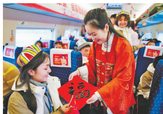
▲在G2771次列车上，乘务人员给来自新疆的青少年送“福”字。