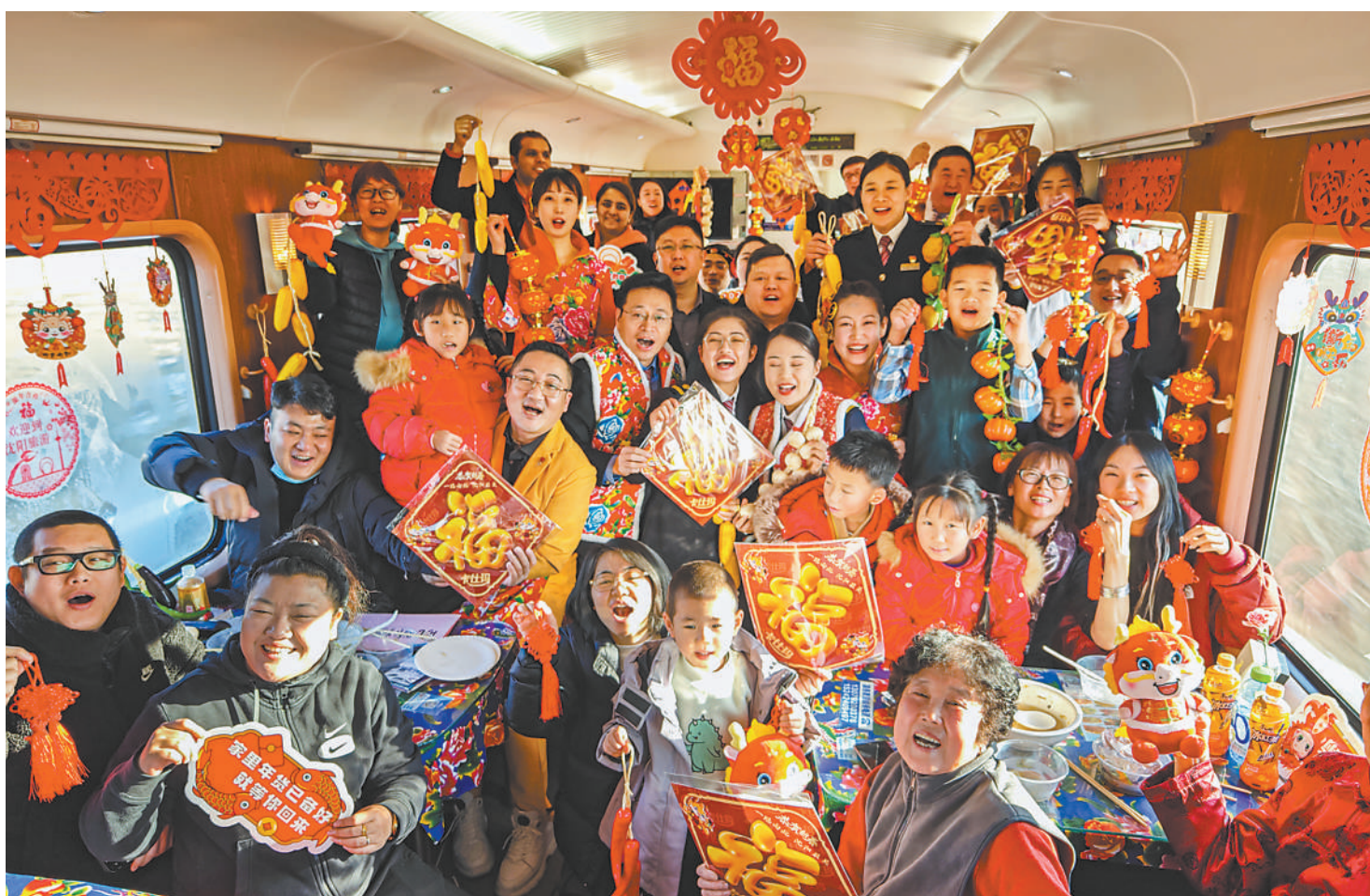
▲在辽宁沈阳开往广东广州的Z12次列车上，一场精彩的演出后，旅客与乘务人员合影。