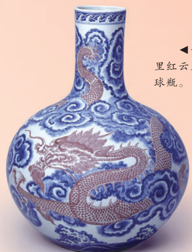
▲青花釉里红龙纹天球瓶。