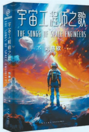
《宇宙工程师之歌》：刘慈欣主编；新星出版社出版。