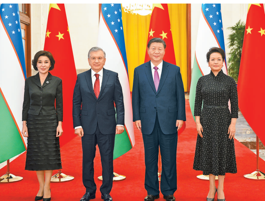
一月二十四日下午,国家主席习近平在北京人民大会堂同来华进行国事访问的乌兹别克斯坦总统米尔济约耶夫举行会谈。这是会谈前,习近平和夫人彭丽媛在人民大会堂东大厅为米尔济约耶夫和夫人米利济约耶娃举行欢迎仪式。