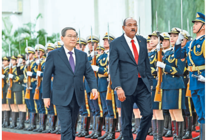
1月24日上午,国务院总理李强在北京人民大会堂同来华进行正式访问的安提瓜和巴布达总理布朗举行会谈。这是会谈前,李强在人民大会堂北大厅为布朗举行欢迎仪式。

新华社北京1月24日电 国务院总理李强1月24日上午在人民大会堂同来华进行正式访问的安提瓜和巴布达总理布朗举行会谈。