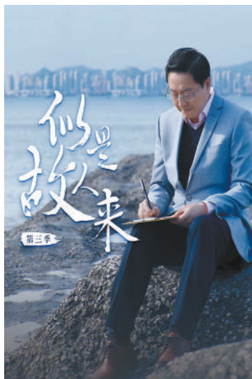
图为实景文化类访谈节目《似是故人来》第三季海报。

随着全社会文化自信不断增强,传统文化类节目受到欢迎。实景文化类访谈节目《似是故人来》第三季在延续“实景走访+深度对话”形式的基础上,进一步聚焦社会热点,回应大众关切,从“人工智能是否会取代人工翻译”等热点问题切入,通过主持人与专家学者交流互动,生动剖析中华文化内涵。故宫博物院院长王旭东分享中华文化蕴藏的兼收并蓄、吐故纳新的精神特质;中国民间文艺家协会主席潘鲁生带领观众走进民间艺术的多彩世界;中国政府友谊奖获得者潘维康倾情讲述自己的中国情缘。从真实可感的事物入手与嘉宾“拉家常”,营造出代入感和亲切感,让并不熟悉该领域的观众也能顺畅地走进历史,理解中华文化的思想内涵。节目嘉宾从事文化工作数十年,他们的梳理与讲述饱含深情,唤醒观众内在的文化情怀,激发人们对中华文化的热爱与自信。