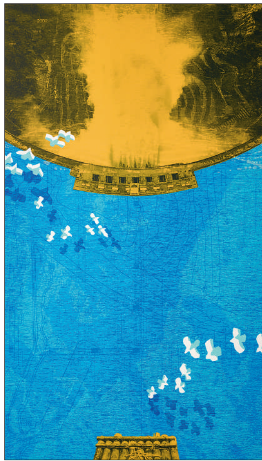
▲版画《蓄势——破译雅砻密码》,作者贺思恩。