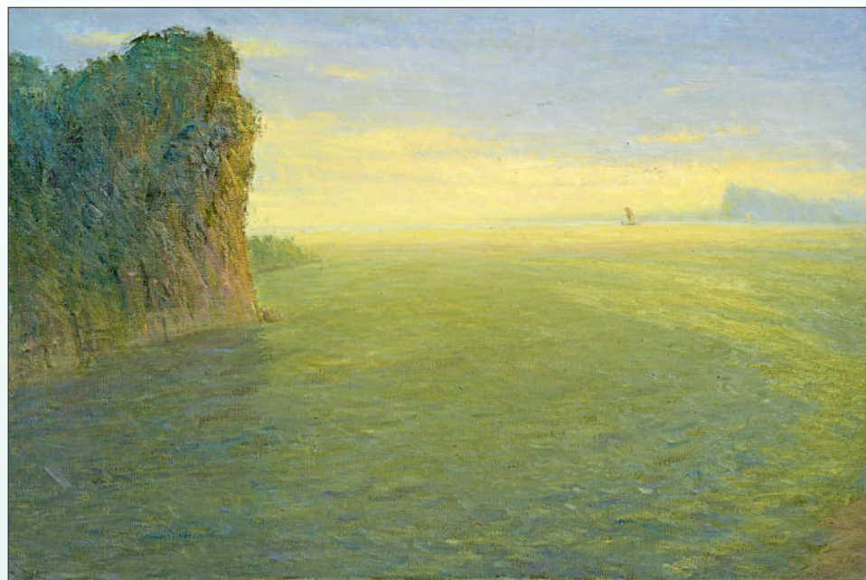
▼中国画《长江春色图》(局部),江苏省国画院集体创作。