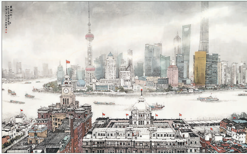
▲中国画《黄浦江畔》,作者刘建。

主旋律与多样化有机统一。在长江主题美术创作中,无论是中国画、油画、版画还是其他画种,都在紧扣主题主线的基础上,强调具有个性特征和地域特色的艺术表达。通览不同地区长江主题美术展览上的作品,能强烈感受到创作主体因对不同空间自然景观、人文精神的感知体悟和审美趣味存在差异,而选用不同艺术语言和表现形式,进而形成了千变万化的艺术面貌。雪域高山的雄壮苍茫、云贵高原的灵动多彩、巴山蜀水的奇秀多姿、锦绣江南的温婉柔润,不仅仅是艺术题材所传达的信息,也是艺术本体语言所追求的美学品格。长江文化内涵的丰富性也自然蕴