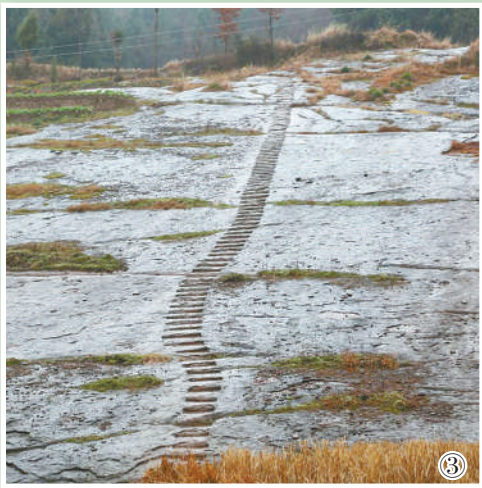
图①:古蜀道金牛道翠云廊的古柏。 图②:古蜀道上的阆中古城。 图③:古蜀道之青龙咀古道。