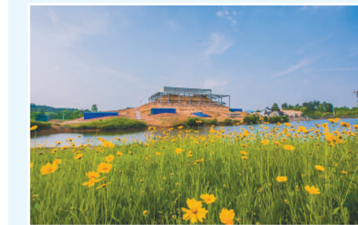
▲安吉古城遗址的越国贵族大墓。 ▶安吉古城遗址博物馆中,学生们合作完成模拟文物修复项目。