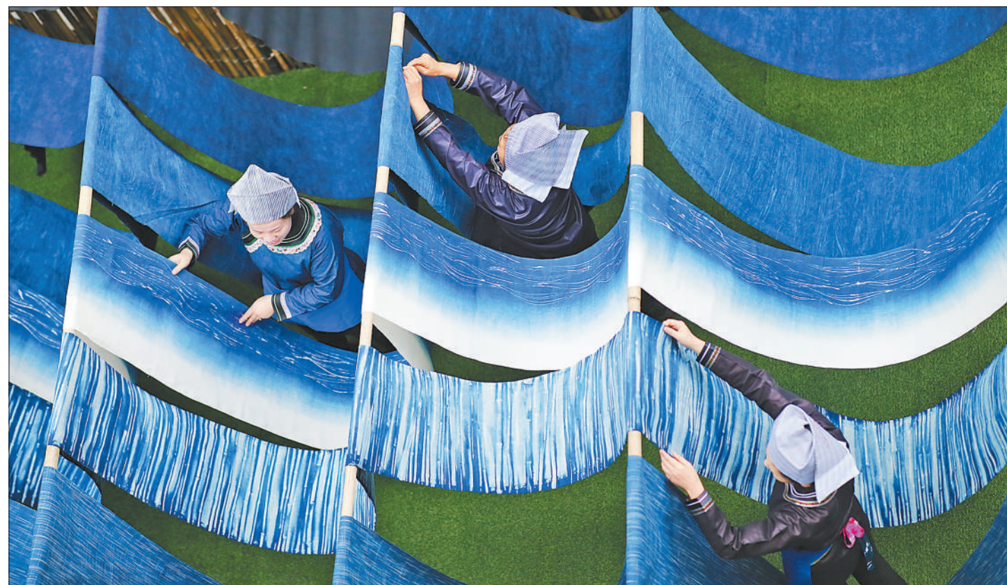
春节临近，贵州省黔东南苗族侗族自治州凯里市的蓝染布工艺品企业开足马力，赶制订单，保障春节市场供应。图为1月18日，手工艺人在凯里市一工作坊晾晒蓝染布。

该标准要求集约节约用地，强调空间布局的科学、实用、协调，与村庄规划、周边景致、生态环境相协调。拓展了美丽庭院建设的经济功能，提倡在庭院内种植经济型花草树木，发展手工作坊、非遗工坊等特色手工业，有条件的可发展特色民宿、休闲农庄、农家乐、小型采摘园等，鼓励利用庭院发展电商销售、直播带货、快递代理等新业态。