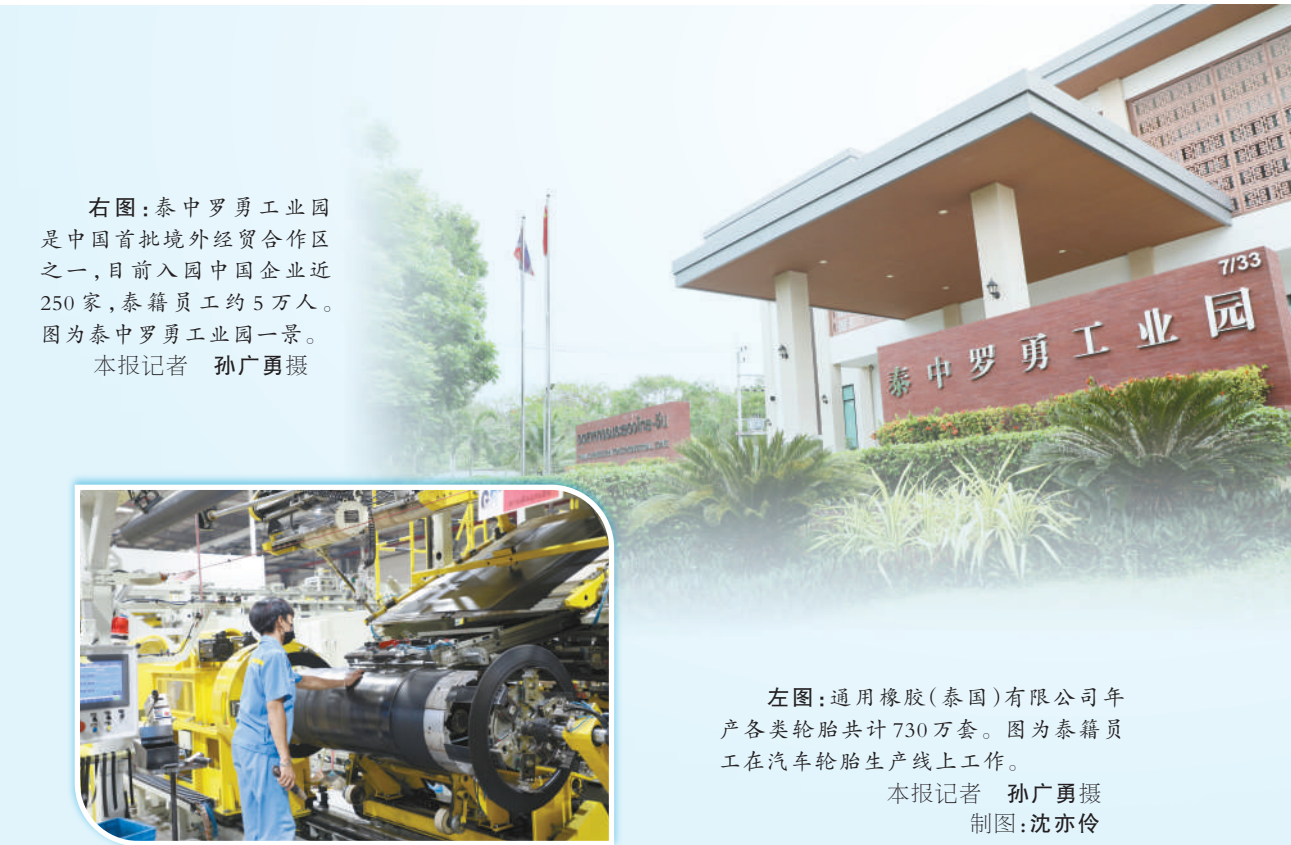
右图：泰中罗勇工业园是中国首批境外经贸合作区之一，目前入园中国企业近250家，泰籍员工约5万人。图为泰中罗勇工业园一景。