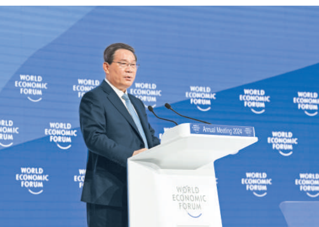
当地时间1月16日上午,国务院总理李强在瑞士达沃斯国际会议中心出席世界经济论坛2024年年会并发表特别致辞。

本报瑞士达沃斯1月16日电 (记者陈尚文、颜欢、禹丽敏)当地时间1月16日上午,国务院总理李强在达沃斯国际会议中心出席世界经济论坛2024年年会并发表特别致辞。世界经济论坛创始人兼执行主席施瓦布主持。