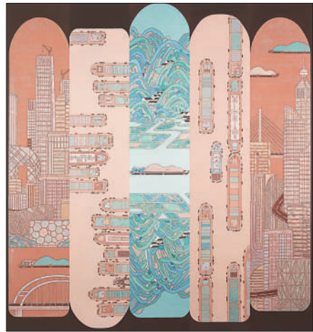
▲中国画《大河之韵》,作者谈鹏。