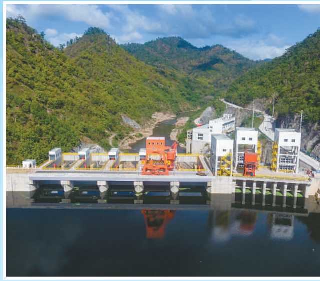
▲中国企业设计建设的洪都拉斯帕图卡Ⅲ期水电站年均发电量达3.36亿千瓦时,能满足洪都拉斯全国约6%的用电需求,不仅为周边地区提供了稳定电力,极大方便了当地居民生产生活,还有助于推动洪都拉斯能源结构调整,为其经济社会发展注入新动力。图为帕图卡Ⅲ期水电站全景。