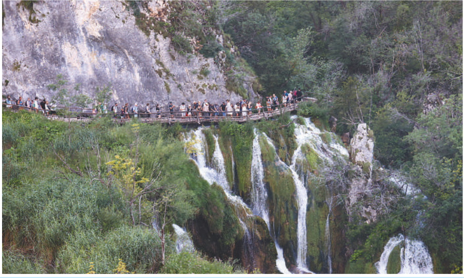
▲克罗地亚普利特维采湖国家公园是中国九寨沟国家级自然保护区的“姐妹”自然遗产地。两者同属喀斯特地貌,是世界非常罕见的冷水钙华景观。中国科学院成都生物研究所与克罗地亚萨格勒布大学合作成立“中国—克罗地亚生物多样性和生态系统服务‘一带一路’联合实验室”,为两国世界自然遗产地生态保育作出重要贡献。图为当地游客在普利特维采湖国家公园参观。