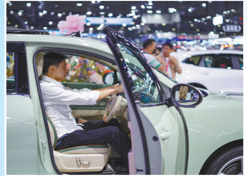
▲在2023年举办的第四十届泰国国际汽车博览会上,中国品牌电动汽车订单量在所有参展品牌中名列前茅。在中国品牌的强劲拉动下,参展电动汽车订单量首次超越燃油汽车订单量。图为当地参观者在车展会上试驾中国品牌电动汽车。