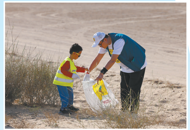
▲在2023年12月5日至16日举行的第二十二届“清洁阿联酋”公益环保活动中,近百名驻阿中资机构志愿者同当地志愿者一起在迪拜马蒙沙漠自然保护区清除沙漠中的垃圾,希望以此改善周边环境,吸引更多社会力量关注绿色环保,为构建绿色生态的地球环境贡献力量。图为一名中资机构志愿者在活动中引导孩子拾捡垃圾。