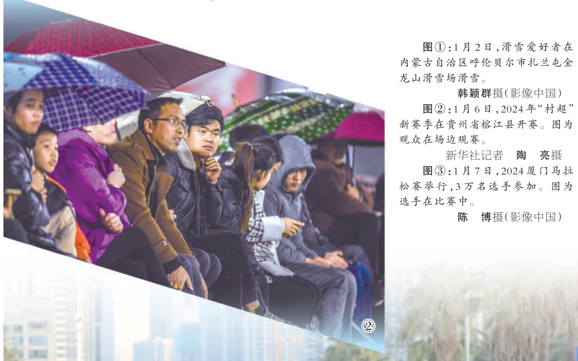
图②:1月6日,2024年“村超”新赛季在贵州省榕江县开赛。图为观众在场边观赛。