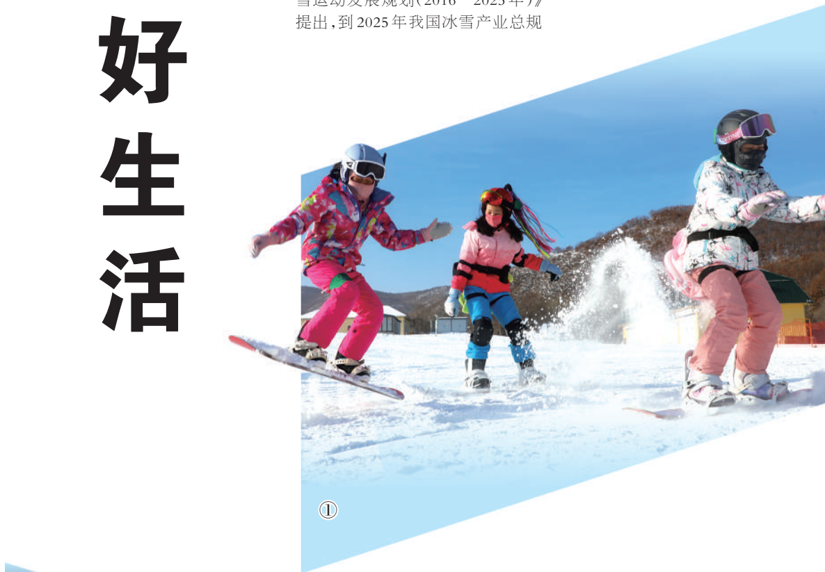
图①:1月2日,滑雪爱好者在内蒙古自治区呼伦贝尔市扎兰屯金山滑雪场滑雪。