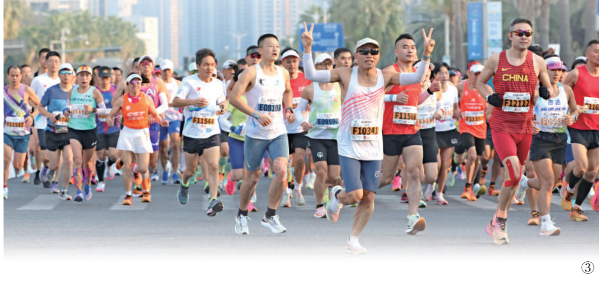
图③:1月7日,2024厦门马拉松赛举行,3万名选手参加。图为选手在比赛中。