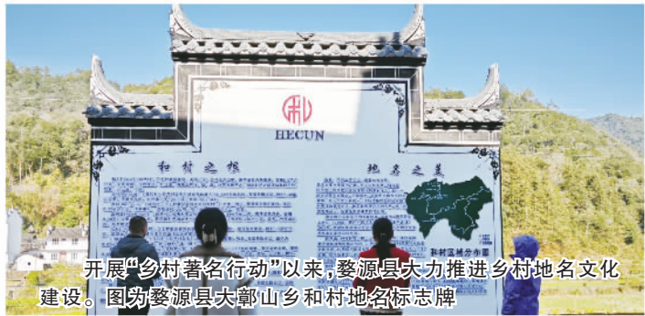
开展“乡村著名行动”以来,婺源县大力推进乡村地名文化建设,图为婺源县大鄣山乡和村地名标志牌