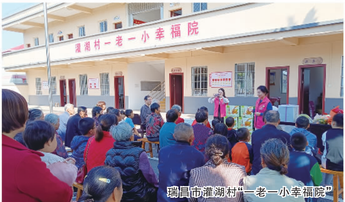
瑞昌市灌湖村“一老一小幸福院”

贯彻落实积极应对人口老龄化国家战略,大力推进基本养老服务体系建设,实施养老服务提质升级三年行动,所有县(市、区)建成特困失能人员集中照护机构,1.5万余名老人得到专业照护。推进乡镇敬老院资源优化配置和“一老一小幸福院”建设改革试点,构建街道、社区、小区、家庭相衔接的“15分钟养老服务圈”,街道和县城镇综合性养老服务中心全覆盖,日间照料中心总数达4234个、覆盖90%以上城市社区,城市老年助餐点总数达1558个,新增社区嵌入式养老院52家、家庭养老床位1.4万张,为1.6万余户特殊困难老年人家进行居家适老化改造。