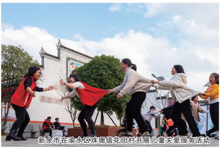
新余市在渝水区珠珊镇花田村开展儿童关爱服务活动