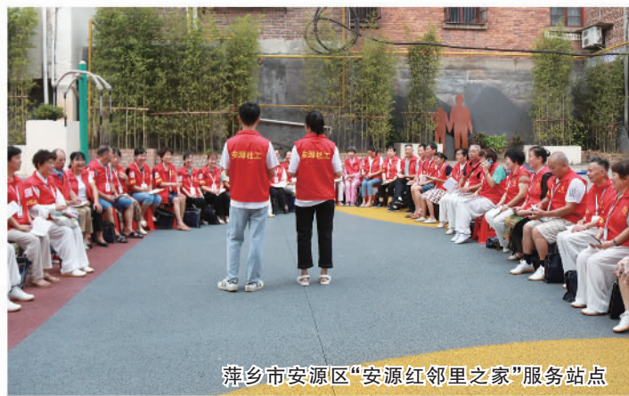
萍乡市安源区“安源红邻里之家”服务站

实施“五社联动 暖心关爱工程”,建设乡镇(街道)民政服务站1502个,覆盖率达94%,服务各类群众157.33万人,2.1万个社区设立志愿服务站点,覆盖率超98%,注册志愿者超过737万人。加强社工人才培育,持证社工数量实现大幅增长。创建“幸福社区”江西品牌,出台引导银发人力资源参与社区社会服务的指导意见,总结推广乐平帮帮团、安源红等一批社区治理典型经验。