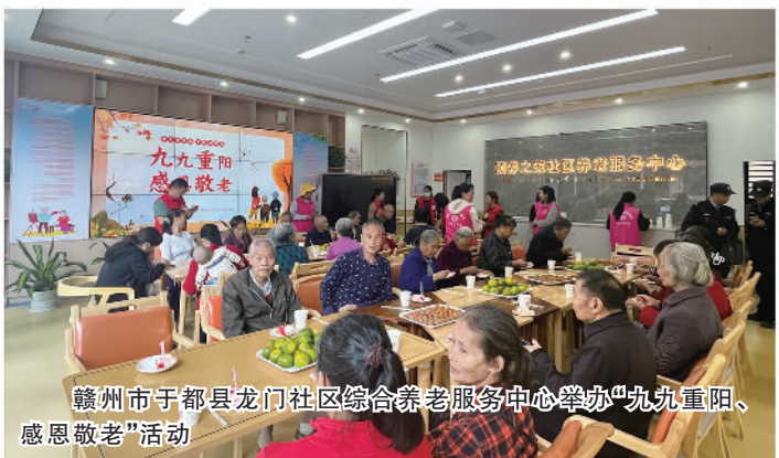
赣州市于都县龙门社区综合养老服务中心举办“九九重阳、感恩敬老”活动