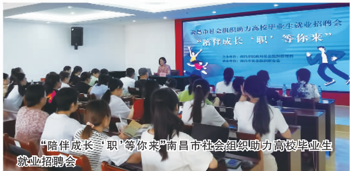
“陪伴成长·职·等你来”南昌市社会组织助力高校毕业生就业招聘会

依托社区、社会组织、民政服务机构等阵地开辟就业岗位10万余个,招收高校毕业生1.5万人。积极助企纾困,开展普惠养老专项再贷款试点,支持23家养老服务企业获得贷款9.09亿元。引导行业协会商会通过减免、降低、取消收费等举措减轻企业负担约4816万元,为行业争取帮扶政策,减轻企业负担约1.7亿元。深化“放管服”改革,打造赣服通“民政专区”,37项民政事项实现“全程网办”,“公民身后一件事”入选国务院办公厅政务服务效能提升典型经验案例。开展“乡村著名行动”,助力乡村全面振兴,新增乡村地名命名、更名2841条,设置乡村地名标志7414块,采集上图38564条。