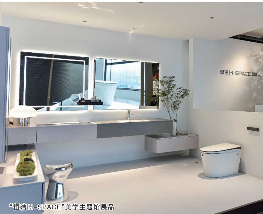
“恒洁H-SPACE”美学主题馆展品