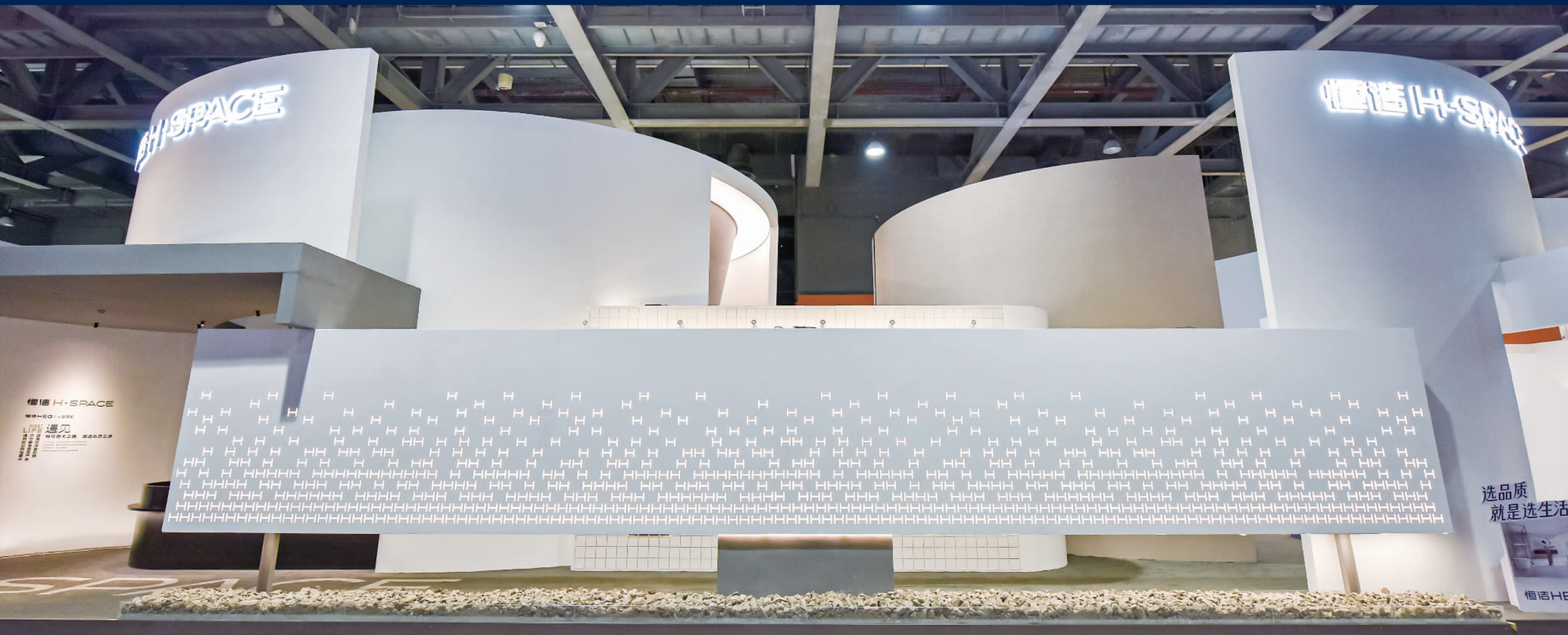
2023广州设计周“恒洁H-SPACE”美学主题馆