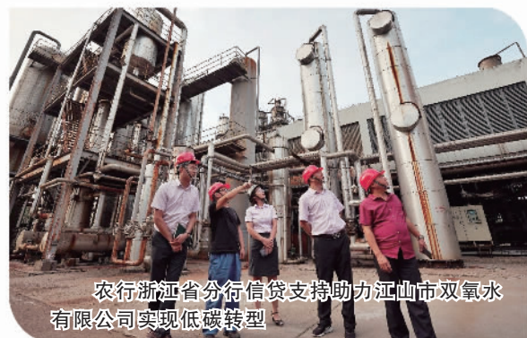
农行浙江省分行信贷支持助力江山市双氧水有限公司实现低碳转型