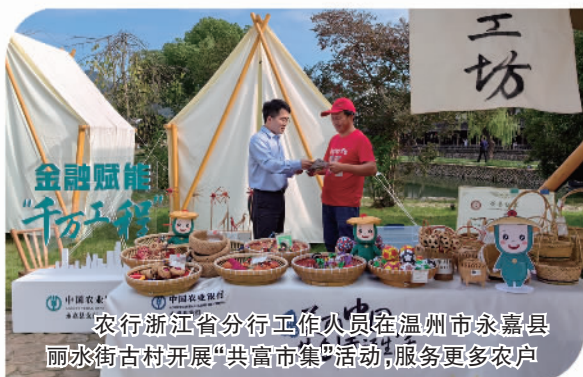
农行浙江省分行工作人员在温州市永嘉县丽水街古村开展“共富市集”活动，服务更多农户