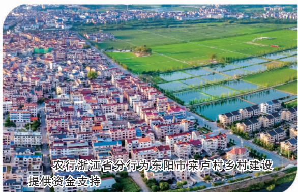
农行浙江省分行为东阳市棠卢村乡村建设提供资金支持