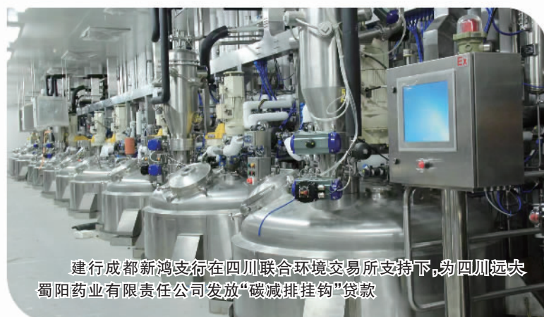
建行成都新鸿支行在四川联合环境交易所支持下，为四川远大蜀阳药业有限责任公司发放“碳减排挂钩”贷款

基层服务的高效运转，得益于建行四川省分行完善的管理体系。省分行层面，成立科创金融发展委员会，由省分行负责人挂帅，聚焦四川省