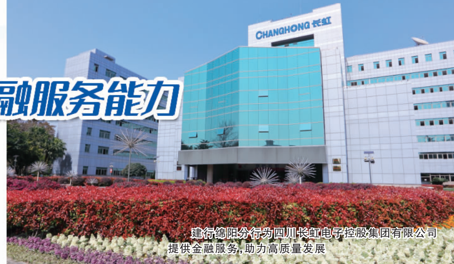
建行绵阳分行向四川长虹电子控股集团有限公司提供金融服务，助力高质量发展