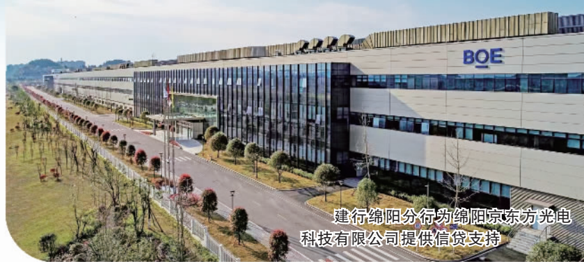
建行绵阳分行向绵阳京东方光电科技有限公司提供信贷支持

科技是国家强盛之基，创新是民族进步之魂。中央金融工作会议提出，做好科技金融、绿色金融、普惠金融、养老金融、数字金融“五篇大文章”。成渝地区是全国首个获批建设的区域科技创新中心，作为中国建设银行在四川的分支机构，中国建设银行四川省分行（简称“建行四川省分行”）将发展科技金融作为重中之重，按照四川省委、省政府关于建设国家创新驱动发展先行省的工作要求，聚焦重点领域、优化服务模式、增强外部协作，持续提升专业化、综合化、特色化科技金融服务能力。