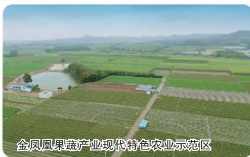
金凤果蔬产业现代特色农业示范区

围绕乡村产业振兴,做好“土特产”文章,实施强链、补链、延链行动,贯通产销、融合农文旅,推动农村一二三产融合发展。积极发挥龙头企业链主作用,今年6家企业入选首批国家现代农业全产业链标准化示范基地创建单位名单,数量居全国前列。大力发展初加工和精深加工,全区农