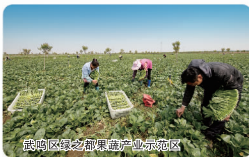
武鸣区绿之都果蔬产业示范区

产品综合加工转化率达68.1%。稳步推进农产品冷链物流体系建设,全区总储藏能力达220万吨。推出果蔬等专列,实现“点对点”产销对接,每年外调蔬菜1000万吨以上。立足生态优势,加强绿色农产品有效供给,“三品一标”产品总数2554个,其中,地理标志农产品165个,数量保持全国前列。累计遴选发布“桂字号”品牌603个,品牌总价值超5000亿元。依托广西山水、长寿、滨海、民俗、边关等特色,大力发展农业新产业新业态,打造全国休闲农业重点县4个、中国美丽休闲乡村70个。