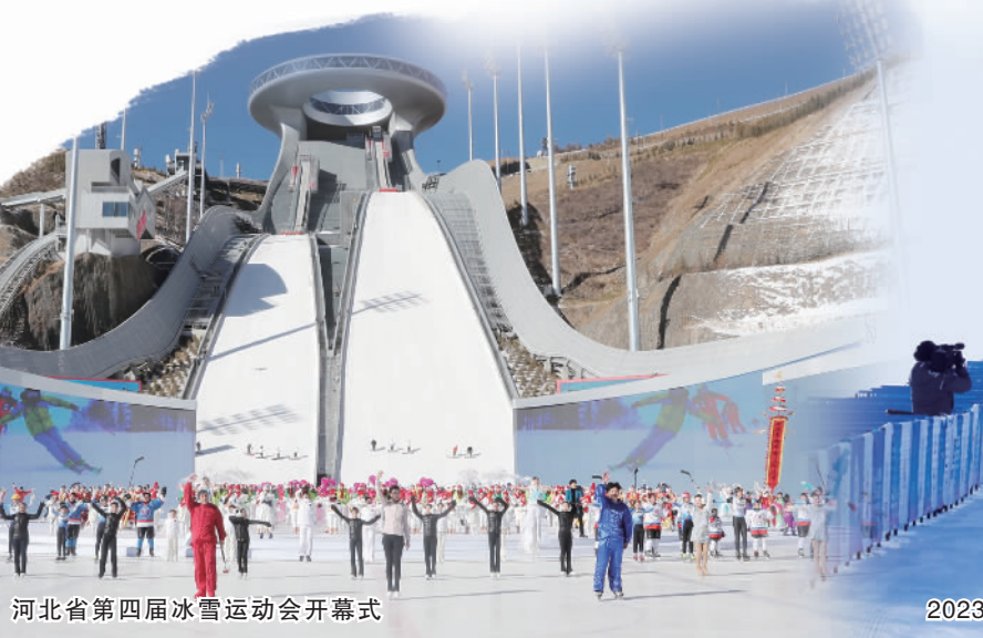
河北省第四届冰雪运动会开幕式