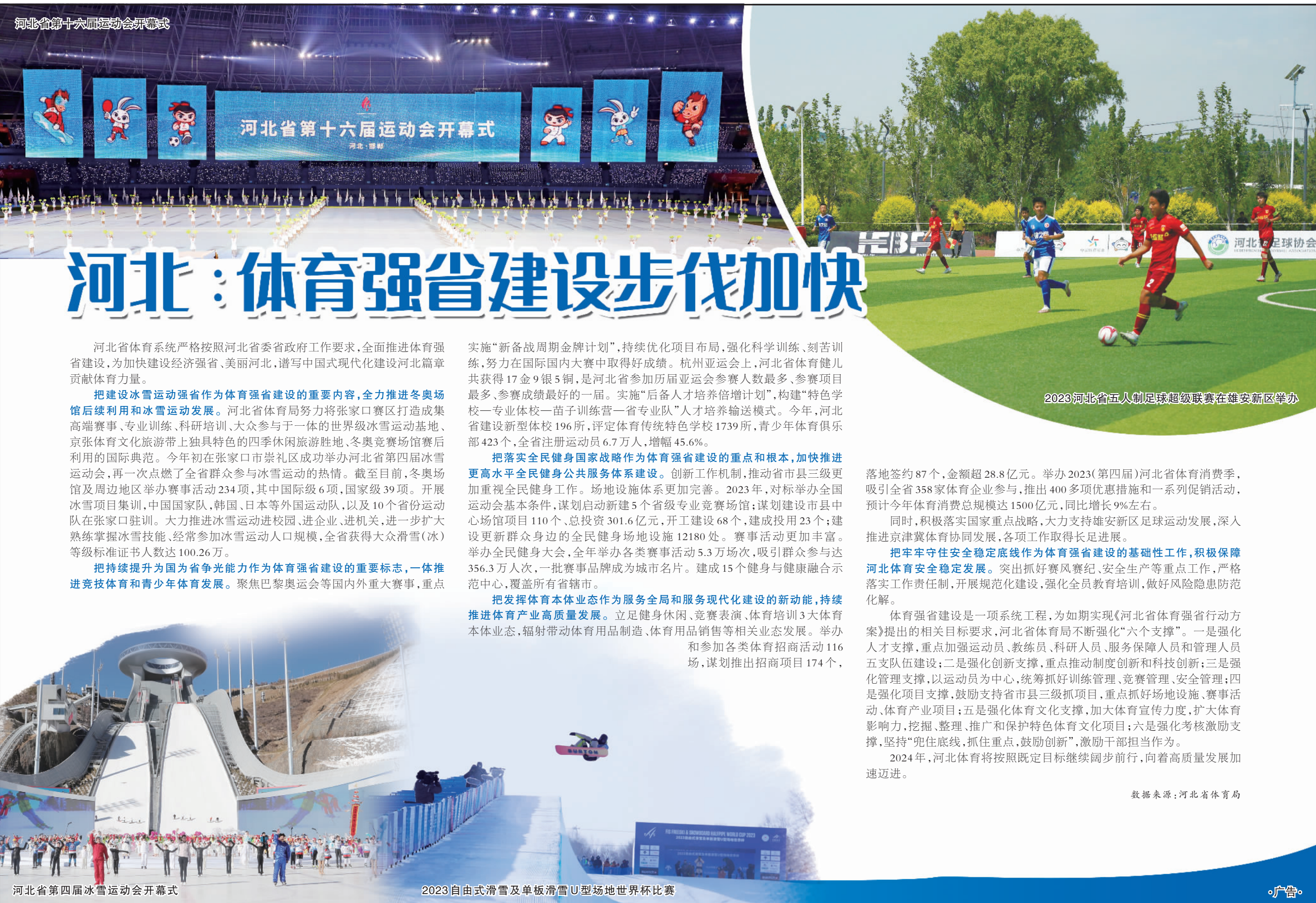
河北省第十六届运动会开幕式