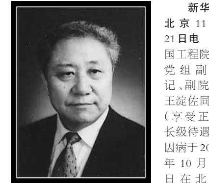
新华社北京11月21日电 中国工程院原党组书记、副院长王淀佐同志（享受正部长级待遇），因病于2023年10月25日在北京逝世，享年89岁。

王淀佐同志逝世后，中央有关领导同志以不同方式表示哀悼并向其亲属表示慰问。 王淀佐，1934年3月生，辽宁凌海人。1950年3月参加工作，1956年8月加入中国共产党。1950年10月起先后任东北有色金属管理局选矿科技员，重工业部有色金属工业管理局技术员等。1961年8月起先后任中南矿冶学院助教、讲师、副教授、副院长、院长，中南工业大学校长。1991年当选为中国科学院院士。1991年12月起先后任北京有色金属研究总院院长，北京有色金属研究总院院长、中国有色金属工业总公司总经理科技高级顾问，北京有色金属研究总院名誉院长。1994年当选为中国工程院院士。1998年6月至2006年6月先后任中国工程院副院长、党组成员，党组副书记、副院长。