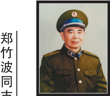
新华社南京11月8日电 正兵团职离休干部、原南京军区空军政治委员郑竹波同志，因病医治无效，于10月28日在南京逝世，享年102岁。

八是不断提升民生福祉，兜住、兜准、兜牢民生底线。更加突出就业优先导向，持续促进农民增收，扩大中等收入群体。健全分层分类社会救助体系，发展养老事业和养老产业，完善生育支持政策体系。加强生态系统保护和修复，持续深入打好蓝天、碧水、净土保卫战。