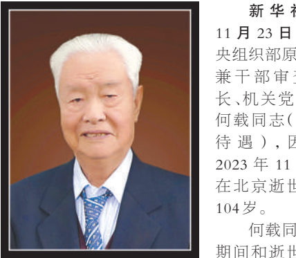
新华社北京11月23日电 中央组织部原秘书长兼干部审查局局长、机关党委书记何载同志（部长级待遇），因病于2023年11月8日在北京逝世，享年104岁。

何载同志病重期间和逝世后，中央有关领导同志以不同方式表示慰问和哀悼。 何载，原名容恭，陕西宝鸡人，1919年11月生于甘肃成县。1936年底加入中华民族解放先锋队并参加革命工作，1938年2月加入中国共产党。1936年底起先后在陕西关中、甘肃陇南参加抗日救亡活动。1940年9月起先后任陕北三丹丹县征粮工作团团长，中央宣传部陕北延川县访问团副团长等。1944年12月起先后任中共中央西北局组织部秘书、办公室主任等。1951年4月起先后任中央办公厅秘书室秘书、秘书室负责人。1958年7月下放农场劳动。1962年起先后任山西省图书馆主任、运城地区科委副主任等。1978年起先后任中央组织部审改办公室负责人、干部审查局局长。1983年7月至1986年6月先后任中央组织部秘书长兼干部审查局局长、机关党委书记。1995年6月离休。