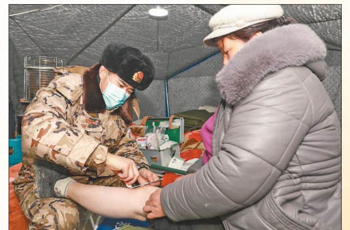
12月19日,武警青海总队医院军医为受伤群众进行治疗。