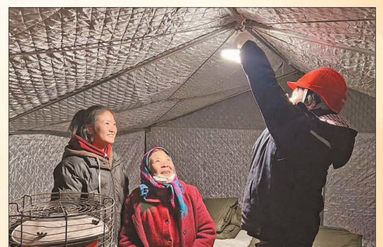
12月19日19时许,青海省民和县临时安置点,抢修人员为帐篷接通电源,保障受灾群众生活用电。