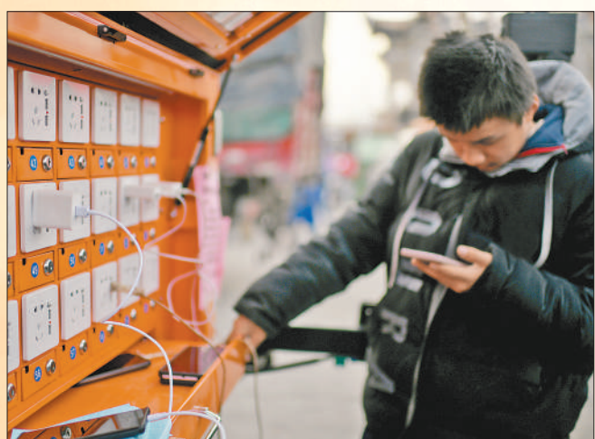
12月20日,甘肃省积石山县大河家镇大河村安置点,受灾群众在充电站给手机充电。