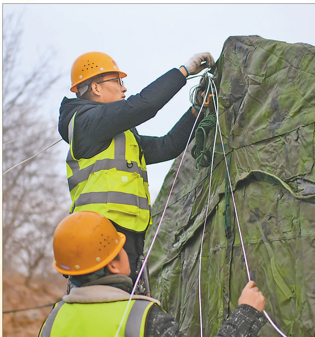
12月20日,甘肃省积石山县大河家镇大河村安置点,工作人员在布设无线网络。