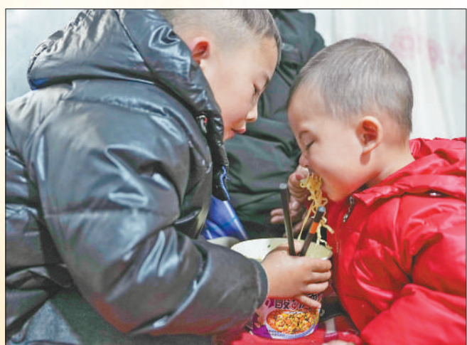
12月20日,甘肃省积石山县大河家镇陶家村安置点,小朋友在帐篷里吃泡面。