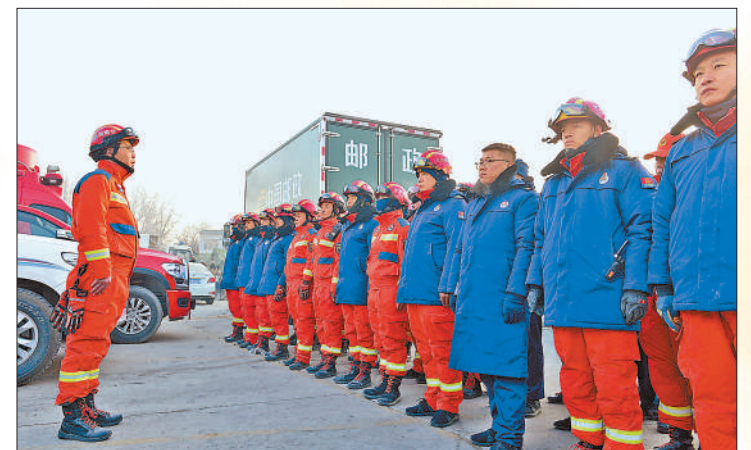
12月20日早晨,甘肃省积石山县大河家镇,消防救援人员整装待发。