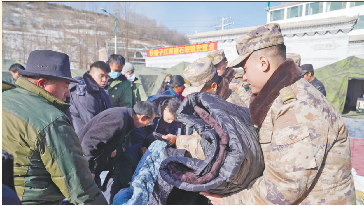
12月20日,甘肃省积石山县石峡镇安置点,陆军第76集团军某旅官兵帮助工作人员为受灾群众发放御寒衣物。

12月18日,甘肃临夏州积石山县发生6.2级地震。地震发生以来,各地各部门坚决贯彻落实习近平总书记重要指示精神,快速响应,迅速行动,全力开展搜救,全力救治受伤人员,最大限度减少人员伤亡,防范发生次生灾害,妥善安置受灾群众,保障群众基本生活。社会各界积极支持,各种救援力量投身救灾一线,帮助灾区群众共渡难关。目前积石山6.2级地震抗震救灾各项工作持续有序进行,救灾机制高效运转。 ——编者