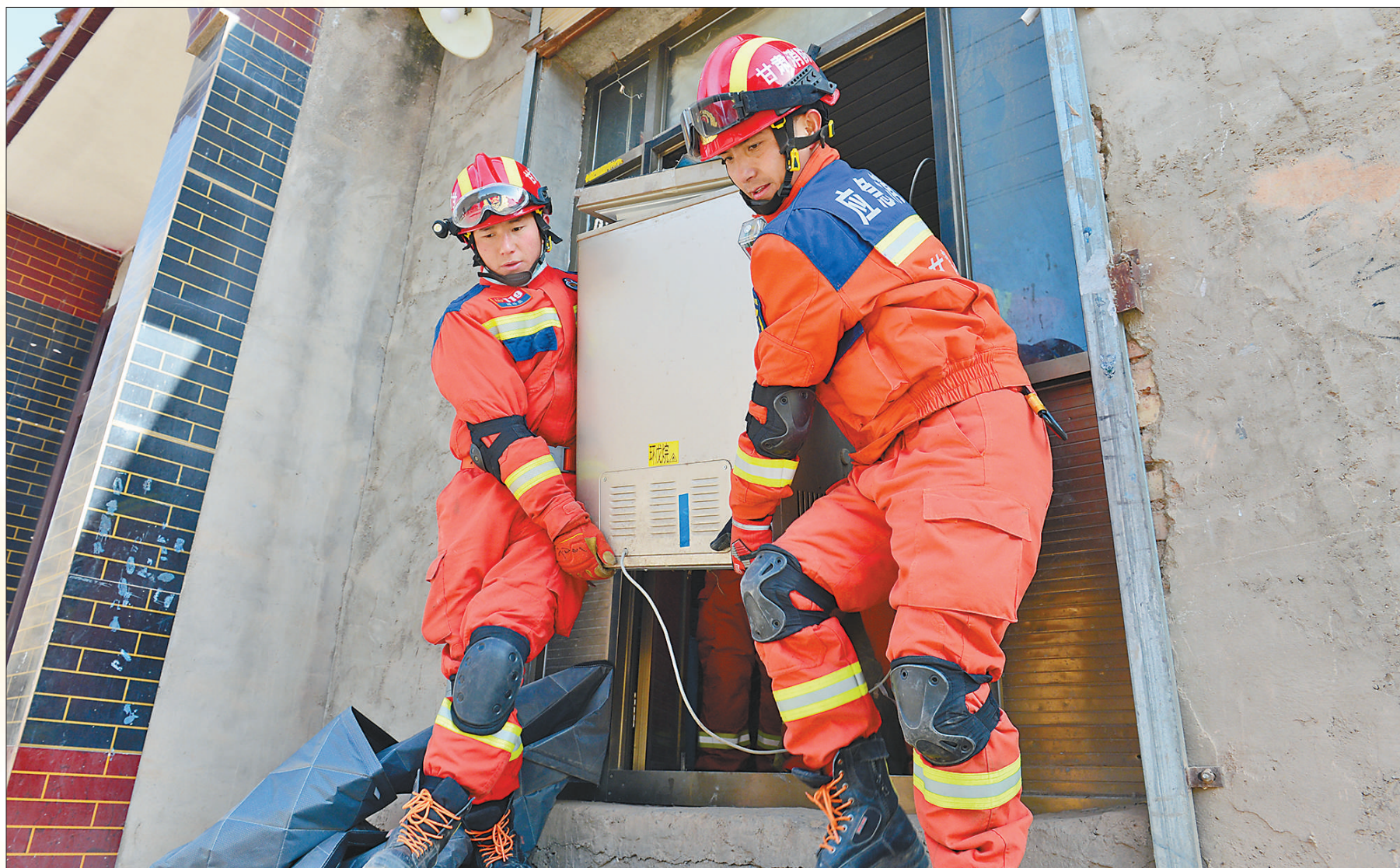
12月20日,甘肃省积石山县大河家镇周家村,消防救援人员在帮群众转移物资。