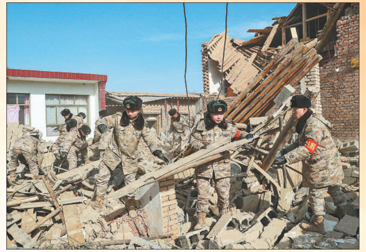
12月20日,甘肃省积石山县大河家镇陈家村,陆军第76集团军某旅官兵在清理废墟。