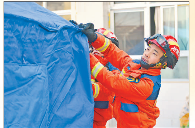
12月20日,甘肃省积石山县大河家镇陈家村,消防救援人员为受灾群众搭建帐篷。