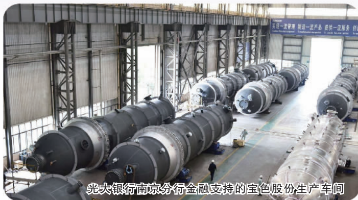
光大银行南京分行金融支持的宝色股份生产车间

中央金融工作会议提出，做好科技金融、绿色金融、普惠金融、养老金融、数字金融“五篇大文章”。