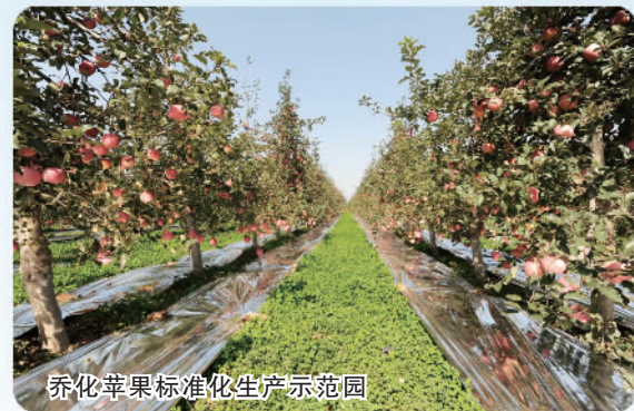
标准化苹果生产示范园

乡村兴，百业兴；粮食稳，天下安。近年来，陕西省凝心聚力加快农业农村现代化步伐，不断提高粮食供给能力，推进乡村全面振兴，有效促进农业高质高效、乡村宜居宜业、农民富裕富足，三秦大地广袤乡村展现出活力奔涌的新气象。