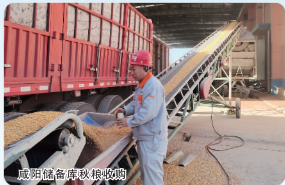
咸阳储备库秋粮收购