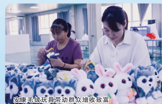
安康毛绒玩具带动群众增收致富