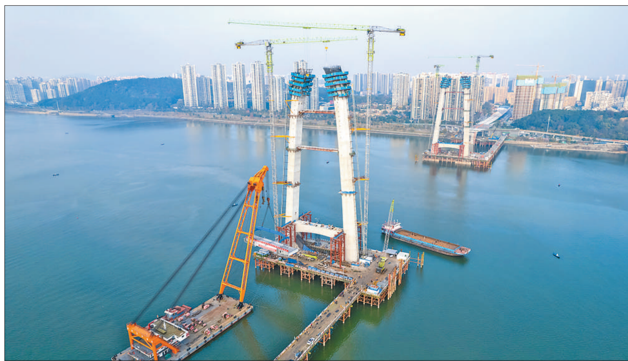
12月12日，由中交一局承建的长沙兴联路大道项目双塔斜拉桥首段主梁顺利架设完成。兴联路大道项目全长5.475公里，主线桥全长4.96公里，跨湘江主桥为双塔斜拉桥，主跨380米。项目建成后将缓解长沙北二环交通压力。图为项目施工现场。