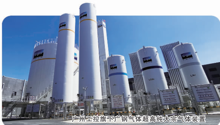
广州工控旗下广钢气体超高压大宗气体装置