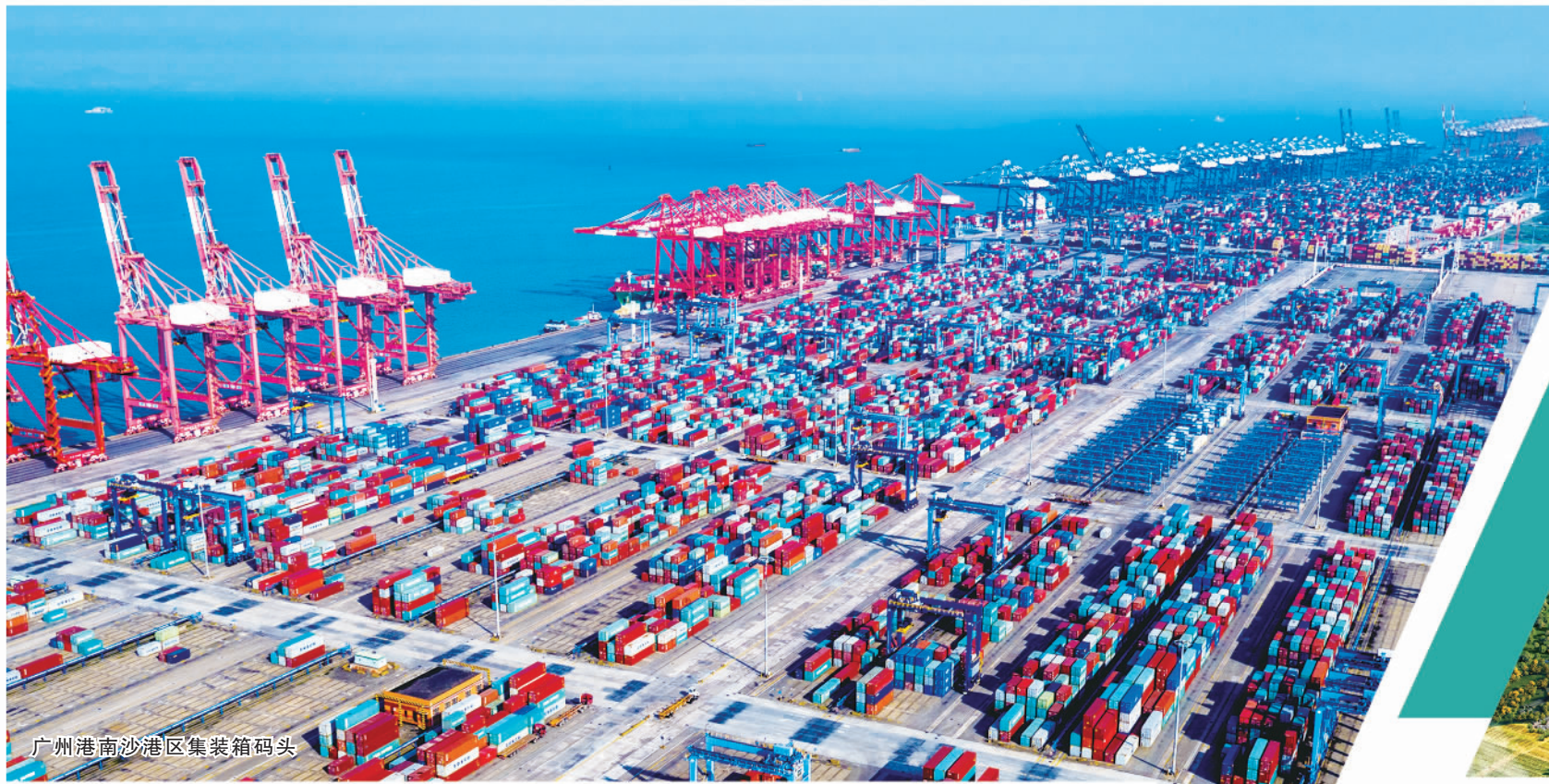
广州港南沙港区集装箱码头