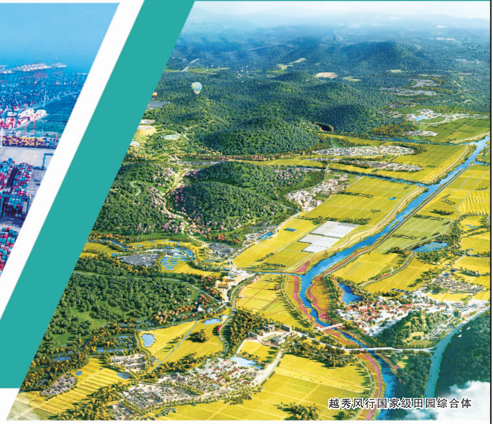
越秀风行国家级田园综合体