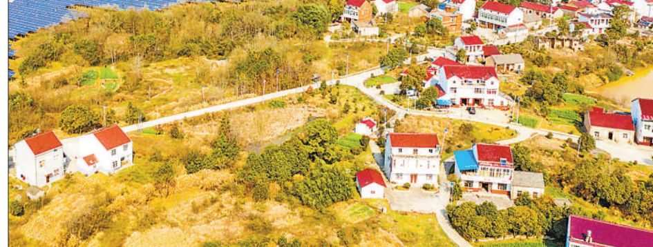
近年来，安徽省合肥市坚持生态保护与绿色发展相统一，大力发展光伏、风电等新能源产业。截至今年10月底，合肥市光伏、风电新能源装机容量达3833.68兆瓦。图为位于庐江县罗河镇东风村的合肥电网光伏电站。

会上，多位国内外企业代表在发言中表示，期待在更广阔领域更高层次加强与深圳对接合作，以取得更多丰硕成果。