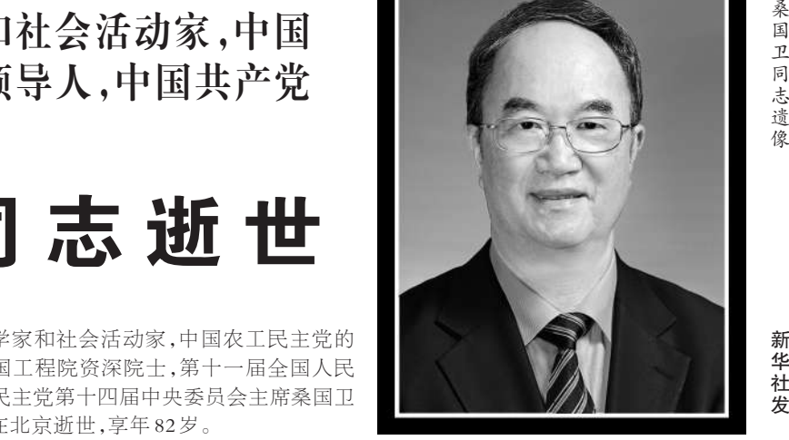
桑国卫同志肖像

新华社北京12月7日电 著名的药学家和社会活动家,中国农工民主党的杰出领导人,中国共产党的亲密朋友,中国工程院资深院士,第十一届全国人民代表大会常务委员会副秘书长,中国农工民主党第十四届中央委员会主席桑国卫同志,因病于2023年12月7日17时10分在北京逝世,享年82岁。