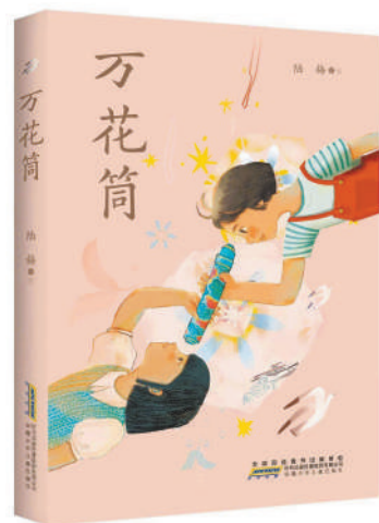
《万花筒》：陆梅著；安徽少年儿童出版社出版。