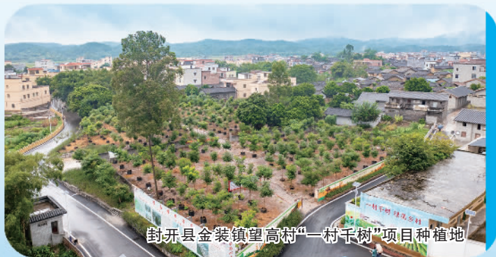
封开县金装镇皇高村“一村千树”项目种植地

肇庆深入实施“强镇工程”和“乡镇强专特分类创建行动”，为全市105个镇（街、乡）精准“画像”、分类施策，推动各镇（街）宜工则工、宜