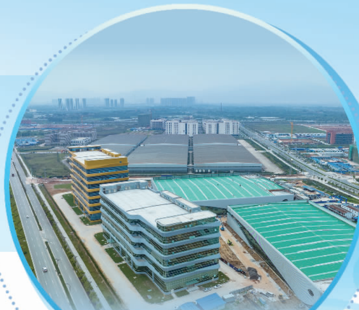
广东省（肇庆）大型产业集聚区富溪片区

让美丽山水迸发发展活力。肇庆着力提升农村人居环境，并依托各村特色资源禀赋，拓展农文旅融合新业态，推出四会古邑绥江碧道画廊、封开贺江碧道画廊等多条乡村旅游精品线路，打造了德庆西江蓝岸民宿、连岸湖居客栈、贺江别苑民宿等高品质民宿，带动民宿产业规范化、规模化、品牌化发展，把乡村魅力转化为经济活力。截至今年6月，肇庆有369个自然村达到特色精品村标准，10121个自然村达到美丽宜居村标准，在建的7条乡村振兴示范带总长256公里、覆盖24个镇（街）。