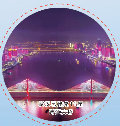
武汉已建成11座跨江大桥