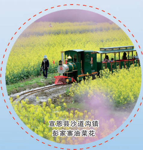
宣恩县沙道沟镇彭家寨油菜花