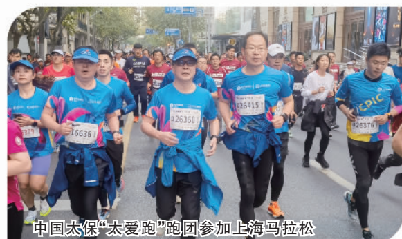
中国太保“太爱跑”跑团参加上海马拉松