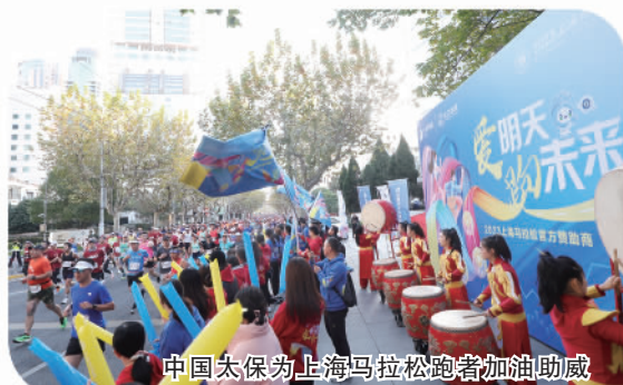
中国太保为上海马拉松跑者加油助威