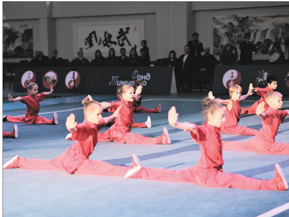
二〇二三年俄罗斯杯暨全俄武术锦标赛十一月十八日至二十日在莫斯科武备宫举行,来自俄罗斯全国各地的七百多名运动员参加比赛。其中年龄最小和最大的运动员分别为七岁和五十六岁,选手们共同角逐三百二十个比赛奖项。图为俄罗斯小朋友们们在比赛期间表演中国功夫。