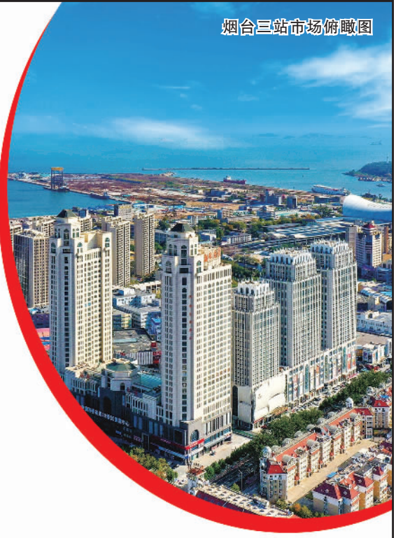
烟台三站市场俯瞰图