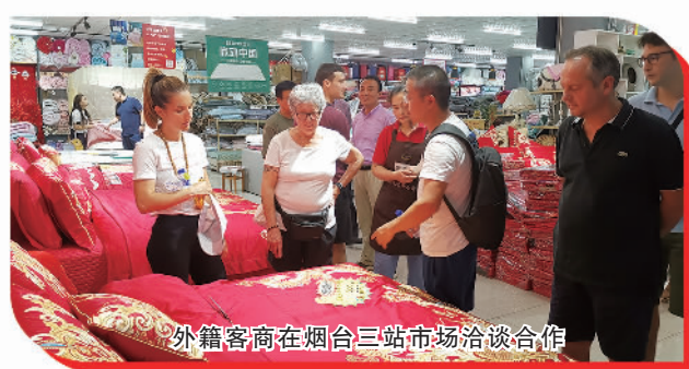
外籍客商在烟台三站市场洽谈合作