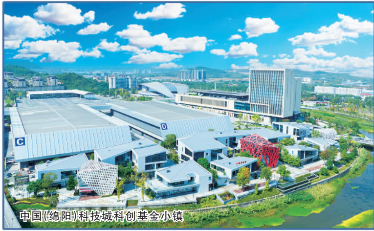
中国（绵阳）科技城科创基金小镇