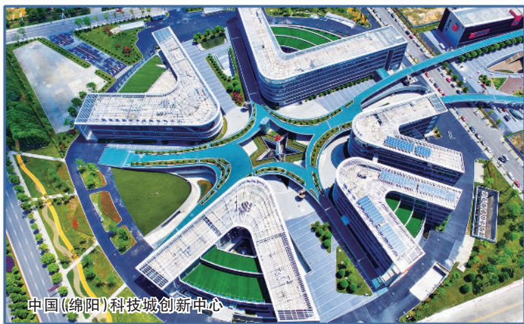
中国（绵阳）科技城创新中心