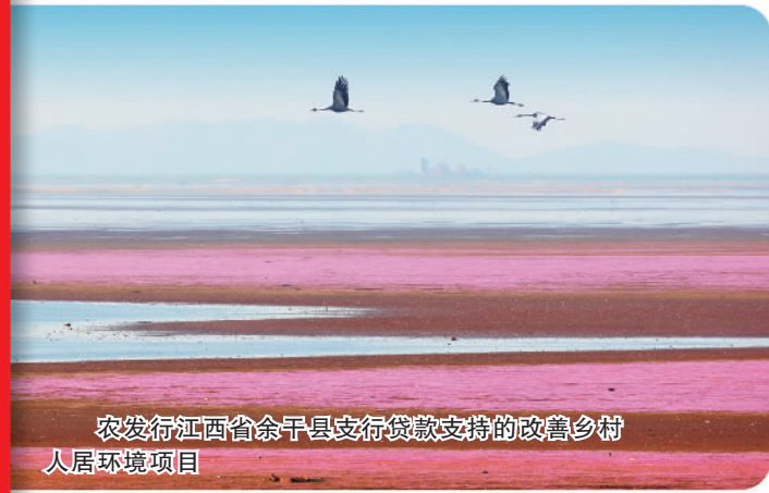
农发行江西省余干县支行贷款支持的改善农村人居环境项目