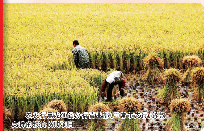
农发行黑龙江省分行营业部(五常市支行)贷款支持的粮食收购项目