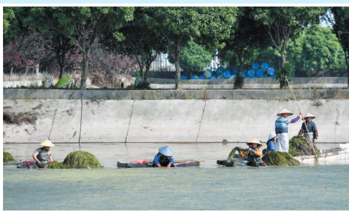
▲湖南省益阳市,工人在大通湖水生植物产业示范园内采收水草。大通湖地处洞庭湖腹地,近年来,当地已完成湖内水生植被修复五期工程,面积达6.7万亩。