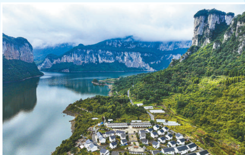
►贵州省黔西市新仁苗族乡化屋村,经过乌江流域水污染防治和生态修复保护等工作,村容村貌焕然一新。