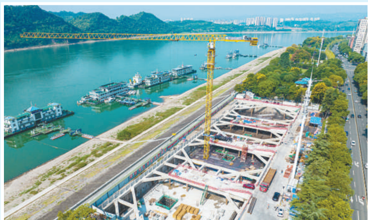
▲湖北省宜昌市,“一江两岸”污水厂网新建、改扩建项目大公桥调蓄池加紧施工。