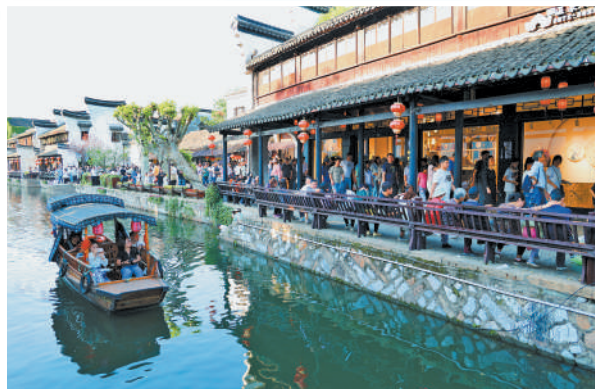
▲浙江省湖州市,国家5A级旅游景区南浔古镇内游人如织。当地持续打造“古镇+”品牌,拓展旅游市场,带动旅游消费。