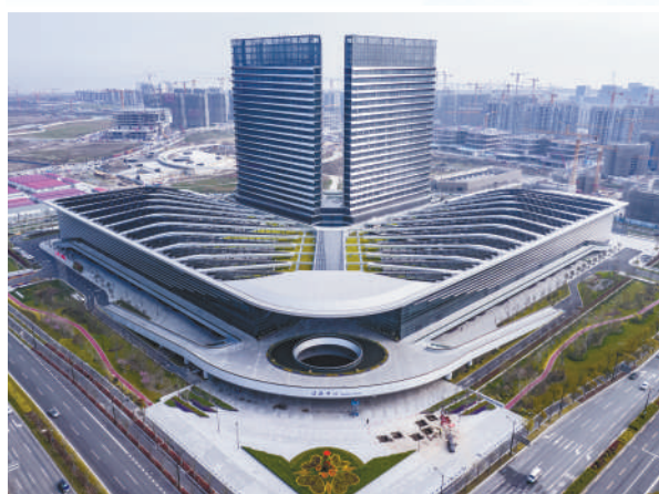
▲位于上海临港新片区国际创新协同区的世界顶尖科学家论坛永久会址。