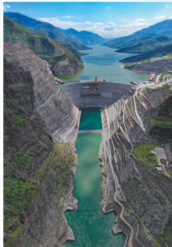
▲位于云南省巧家县和四川省宁南县交界处金沙江干流河段的白鹤滩水电站。