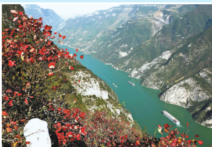
▲重庆市巫山县,轮船航行在红叶映衬下的长江三峡巫峡水域。