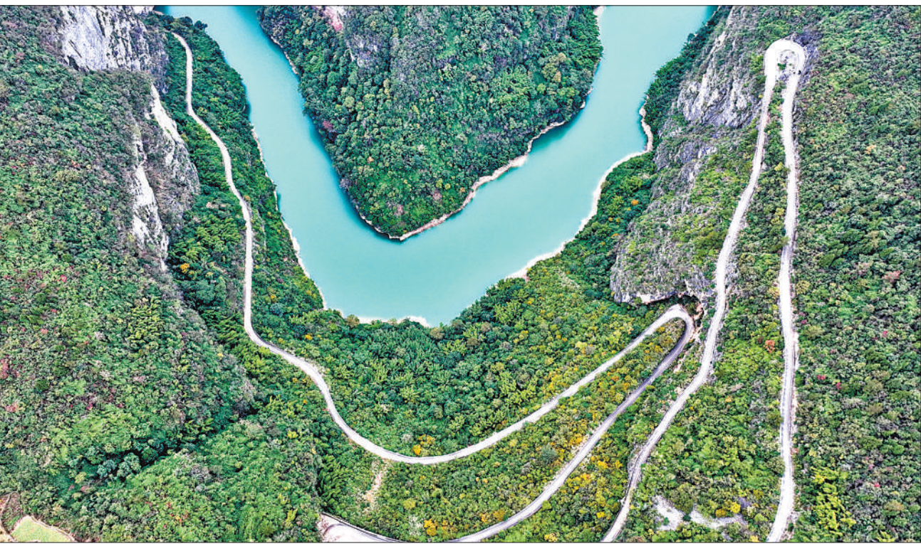
11月14日，重庆市酉阳土家族苗族自治县苍岭镇大河口村，公路在阿蓬江边的悬崖绝壁上蜿蜒盘旋。近年来，当地对重点旅游乡镇原来的通村路网进行了改造完善，不仅带动了乡村产业和农产品的销售，还推动了乡村旅游的发展，助力乡村振兴。