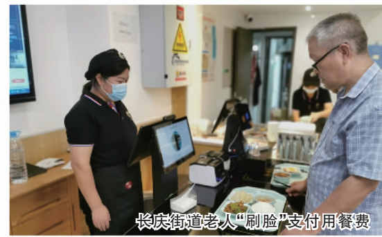
长庆街道老人“刷脸”支付用餐费

在综合考虑老年人口规模、就餐需求、服务半径等因素后，长庆街道积极腾挪拓展空间，通过改建、整合等方式，5家阳光食堂入驻，形成“10分钟就餐服务圈”，让老人能便捷就餐。针对行动不便等特殊老人，还成立送餐队，由34位送餐队成员每天为老年人提供送餐、送菜服务，有效帮扶8000余人次。