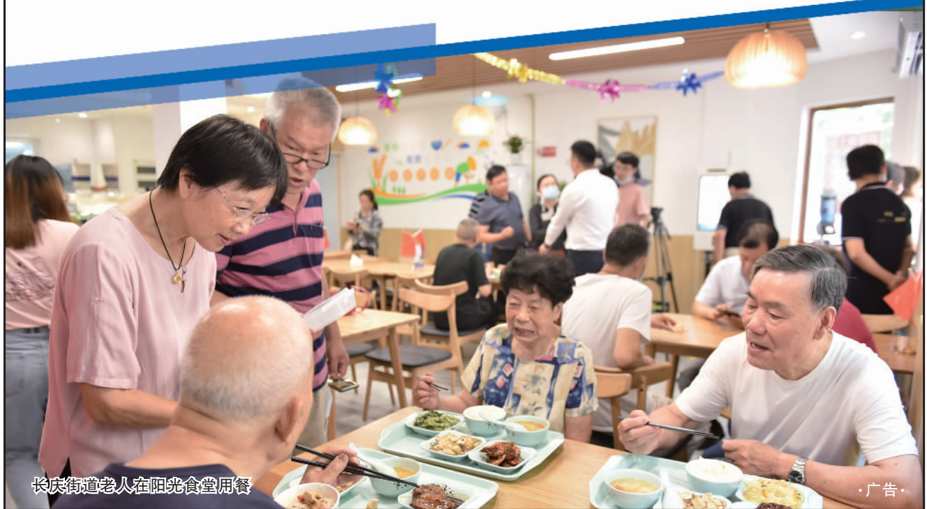
长庆街道老人在阳光食堂用餐

周清玉严重违反党的政治纪律、组织纪律、廉洁纪律、工作纪律和生活纪律，构成严重职务违法并涉嫌受贿、利用影响力受贿犯罪，且在党的十八大后不收敛、不收手，性质严重，影响恶劣，应予严肃处理。依据《中国共产党纪律处分条例》《中华人民共和国监察法》《中华人民共和国公职人员政务处分法》等有关法规，经中央纪委常委会会议研究并报中共中央批准，决定给予周清玉开除党籍处分；按规定取消其享受的待遇；收缴其违纪违法所得；将其涉嫌犯罪问题移送检察机关依法审查起诉，所涉财物一并移送。